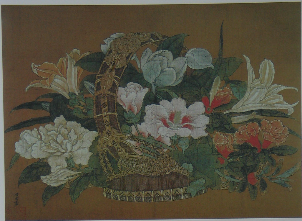
花篮图 宋 李嵩 绢本 设色 纵一九·二厘米 横二六·八厘米

李嵩（一一六六——二四三），钱塘（杭州）人，小时候为木工，后为李从训养子，兴、宁、理三朝画院待诏，工人物道释，尤长界画，《花篮图》写精美编成的提篮中有百合、秋葵、石榴等数种花卉，繁复而不杂乱，花叶交错、深浅正反、生意具足。宋画中常有对景写生的作品，此图在精微摹写对象的同时，不难看出又具有其独特的艺术特色和韵味。