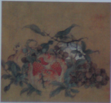
秋果图 宋 曹宗贵 绢本 设色 纵二四厘米 横二五厘米