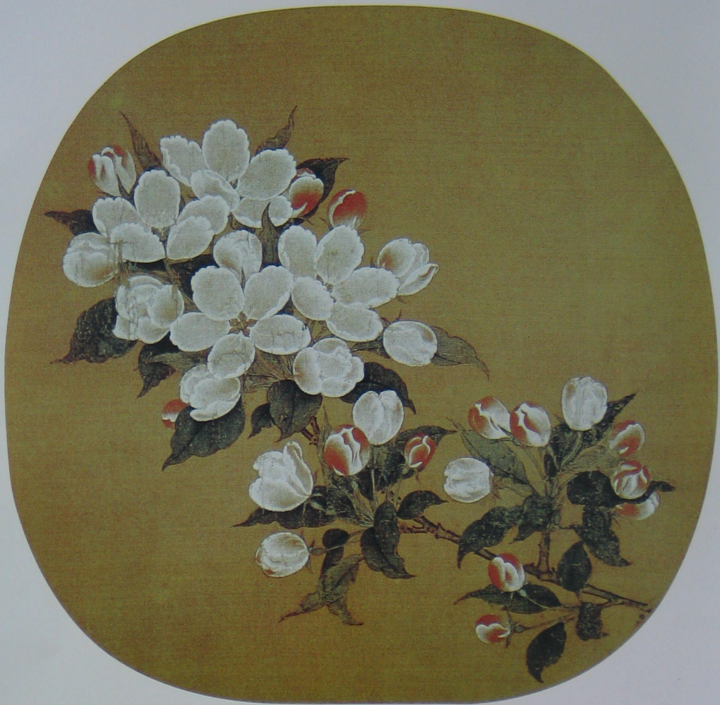
写生海棠图 宋 林椿 绢本 设色 纵二三·四厘米 横二四厘米

《写生海棠图》是宋人林椿的小品。林椿，钱塘（今杭州）人。淳熙（一一七四——一八九）时为画院待诏，赐金带。花草、翎毛、瓜果皆精，师法赵昌，设色清淡，生意盎然，精工逼真。在当时崇尚精微画风的时代，写生无疑是被重视的。林椿此图写折枝海棠一株，横斜在团扇中，根部是尚未全开的花朵，花瓣外朱红的花色斑斓地和花朵结在一起，中间是半开的几朵海棠，绿叶衬托其间，顶上花朵大都打开，临风摇曳。从枝、叶、花茎、花托等都可以看出作者的写实功力和当时崇尚自然的写实画风。