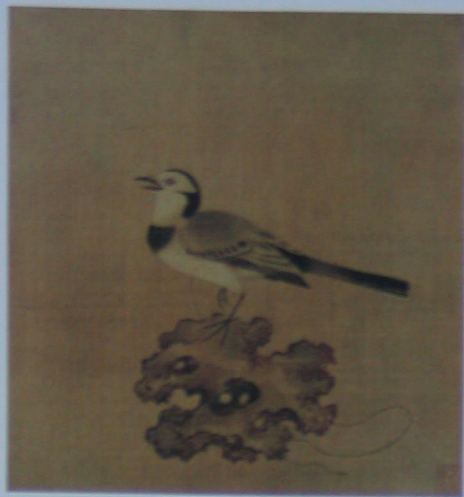
例鸟图 宋 无款 绢本 设色 纵二五·五厘米 横二四厘米