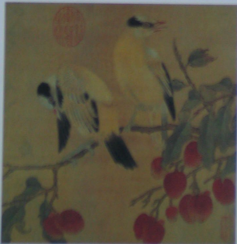
荔枝喜鸟图 宋 无款 绢本 设色 纵二五·四厘米 横二四·八厘米