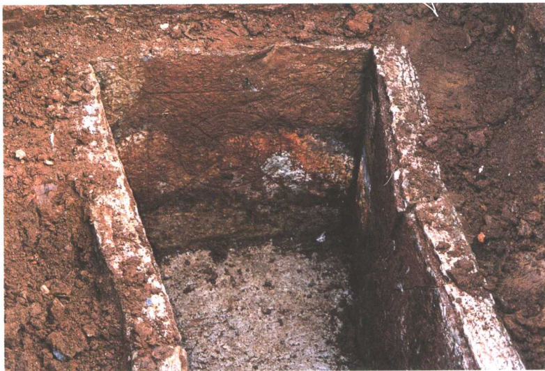
滕州·西汉石槨墓头部档板穿壁图