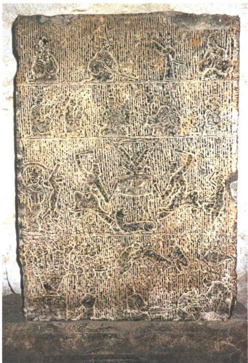
邹城·高李石祠堂后壁画像