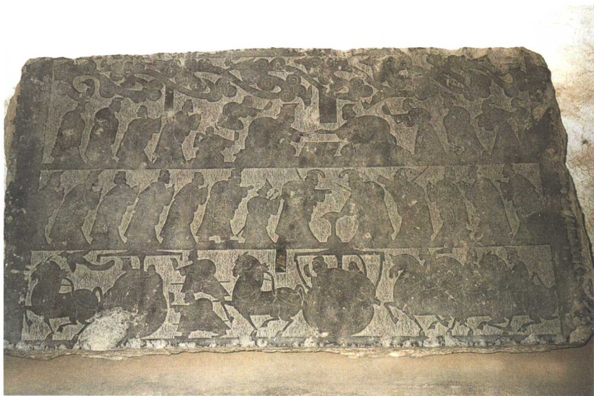
嘉祥·东南店子村石祠画像