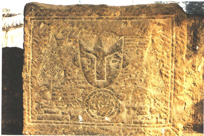
枣庄·石椁墓铺首墓柏画像