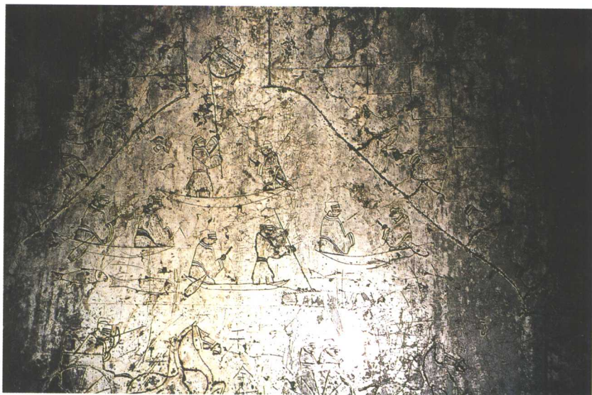
长清·孝堂山石祠泗水捞鼎图