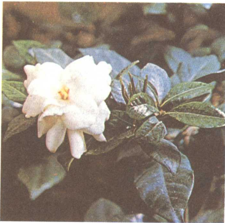
梔子( Gardenia jasminoides )

茜草科(Rubiaceae)的一個觀賞灌木和喬木屬，多觀賞植物，約200種，原產非洲和亞洲的熱帶和亞熱帶。花管狀，白色或黃色。葉常綠，果大，漿果狀，果肉橙色，有黏性。梔子( G. jasminoides )原產於中國，花芬芳，常有出售。