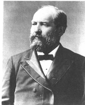
伽菲爾德

美國第 20 任總統。3 歲喪父，生活貧困。1856 年畢業於威廉斯學院。然後回俄亥俄中學任教，後任校長。他擁護反奴隸主義的自由土地原則，不久成為新成立的共和黨的支持者，1859 年選入俄亥俄州議會。南北戰爭期間任步兵上校，後升少將。1862~1880 年為美國眾議員。曾任眾院撥款委員會主席，成為財政問題專家。他主張提高保護關稅，作為一個激進的共和黨人，為南方尋求一個堅實的重建政策。1880 年選入美國參議院。同時出席共和黨全國代表大會，以俄亥俄州代表