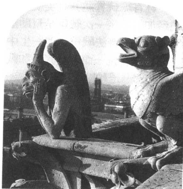
怪獸形排水

建築中用於女兒牆天溝的排水口。原指古典建築檐口的獅頭形排水口或在龐貝城常見的陶製排水口。在哥德式建築後期常作成蹲在檐口上的怪鳥獸形, 伸出很長以使滴水遠離建築。