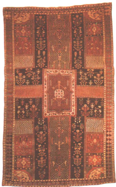
18 世紀的波斯花園地毯，藏於紐約大都會藝術博物館。