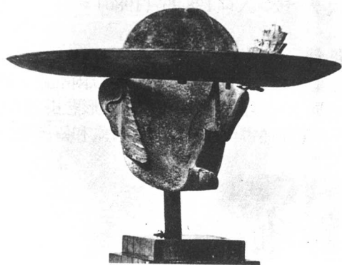
加爾加略[騎馬鬥牛士]

鬥牛士』(Picador, 1928, 紐約市現代藝術博物館)均足以說明其重視人體形象並利用立體主義技術達到現實主義而非抽象風格。去世後，人們曾為他舉辦4次大型展覽(1935, 馬德里和巴黎; 1947, 巴黎; 1955, 威尼斯)。