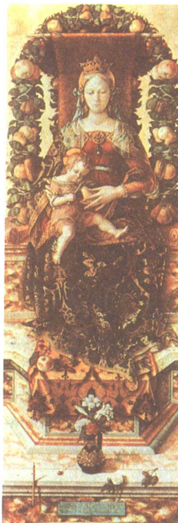
環繞聖母座由水果和葉子組成的花飾

用花朵、葉叢和葉做成的箍或鏈。可以兩端連接形成圓圈，戴在頭上(花冠)；或成環形、弧形懸掛起來(花彩或垂花)。花環從古代起就是宗教儀式和傳統的一