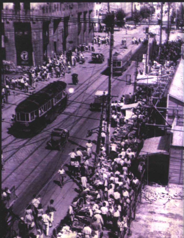
◎——民国时期的广州城，三教九流，光怪陆离