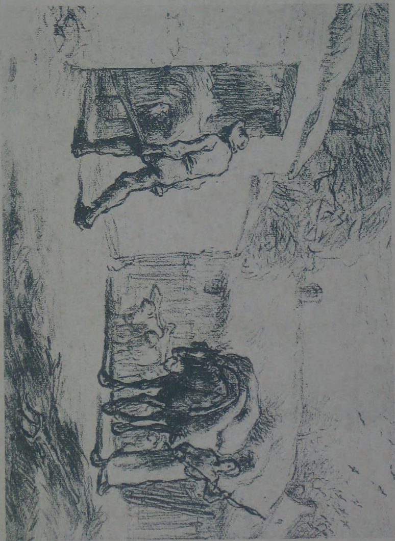
田間歸舍 J. F. MILLER 作