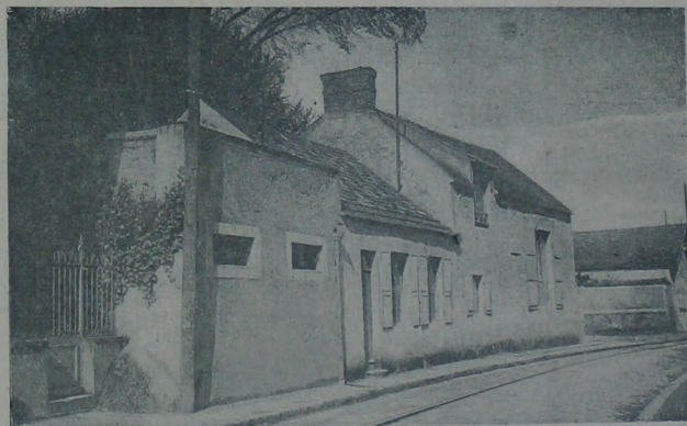
米 勒 的 故 居