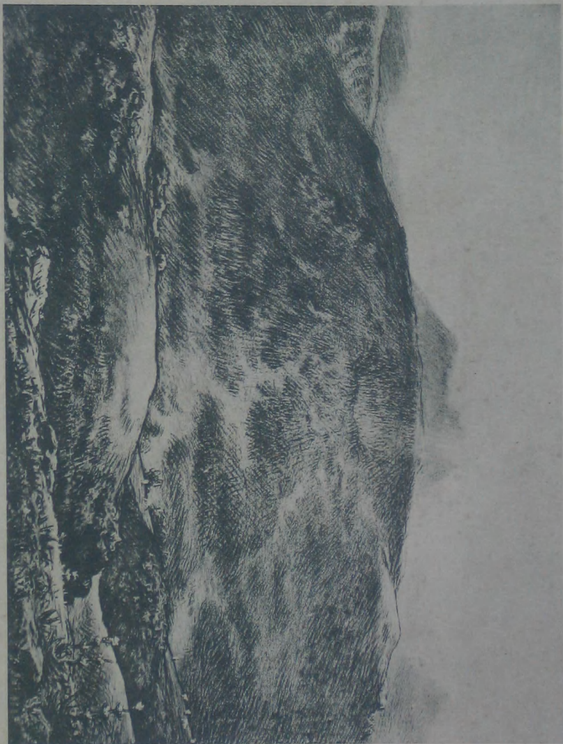
火 山 J. F. MILLET 作