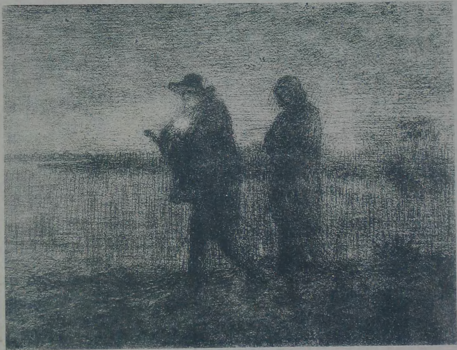
晚 歸 J. F. MILLET 作