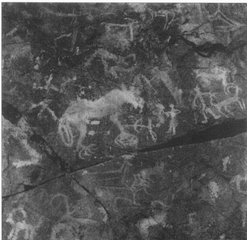
>>> 盘古画像。中国古代有盘古开天地的神话传说。

物到有机物，不断进化才出现了植物、动物和人类。1856年，在德国尼安德特发现了一具距今10万年的人类头骨化石，接着，在非洲发现更古老的类人猿的头骨化石。于是，古人类学家描绘了关于人类起源的一种图景：人类起源经历了四个阶段，第一阶段是南方古猿阶段，距今300万年~440万年前；第二阶段是能人阶段，距今160万年~250万年前；第三阶段是直立人阶段，大约从160万年~180万年前持续到20万年前；第四阶段是智人阶段，晚期智人形态已经达到现代人水平。由于目前第一阶段和第二阶段的类人化石仅发现于非洲大陆，在其他大陆没有发现，一些科学家就认为非洲是人类共同的发源地。