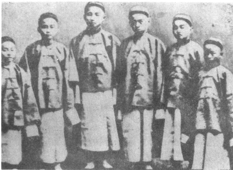
1872年官派留美幼童中的六人