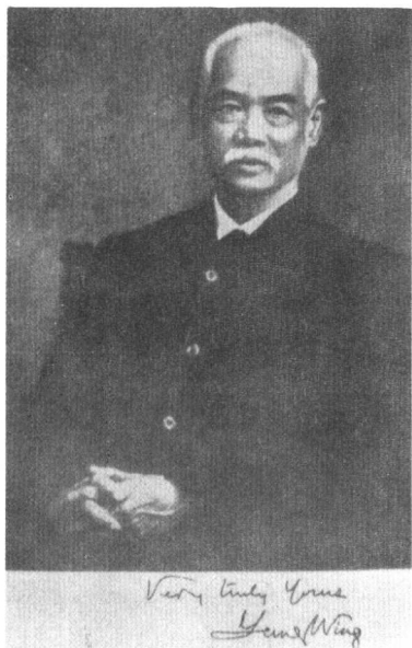
我国最早的留学生容闳