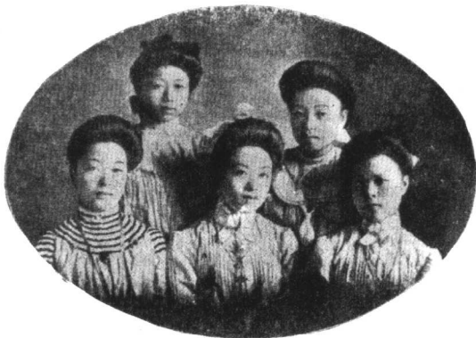
康有为之女康同璧（中坐者）于1903年赴美留学