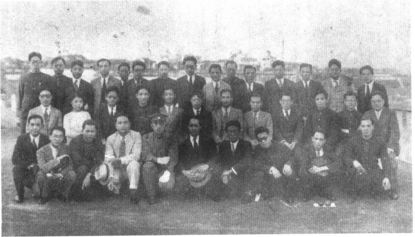
留东（日）学会成立大会代表合影（1936年6月）