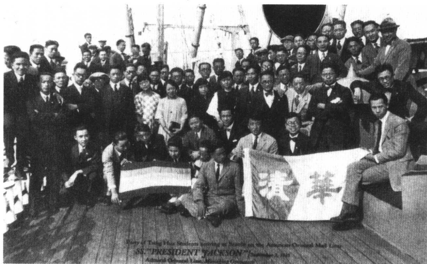
1925年清华留美学生抵达西雅图时在“杰克逊总统号”上的合影