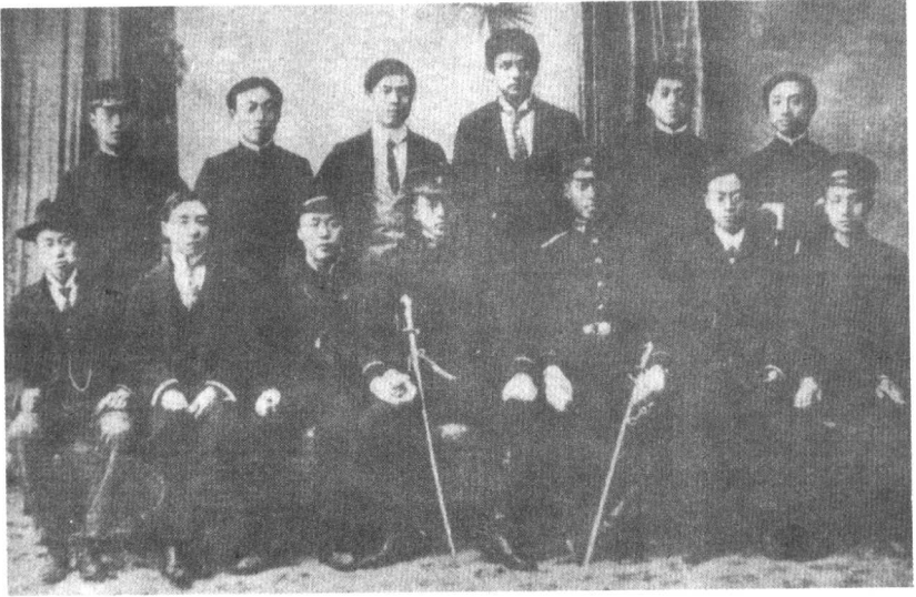
清末留日学生蔡锷（后排左一）等