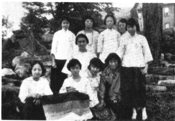
20年代初清华留美女生