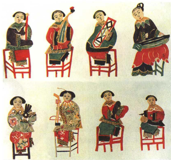
图 15 女乐（清代山东牟平孙绪民）勾绘剪纸