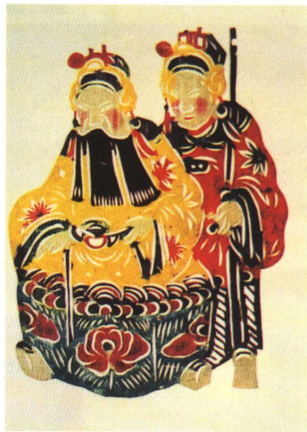
图4 戏曲人物（蔚县王老赏）点染剪纸