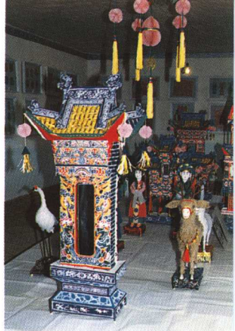
图10 丧俗纸扎 (甘肃西峰)