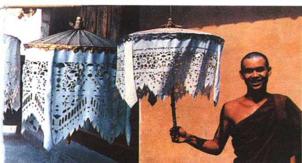
图9 佛伞花 (云南傣族)