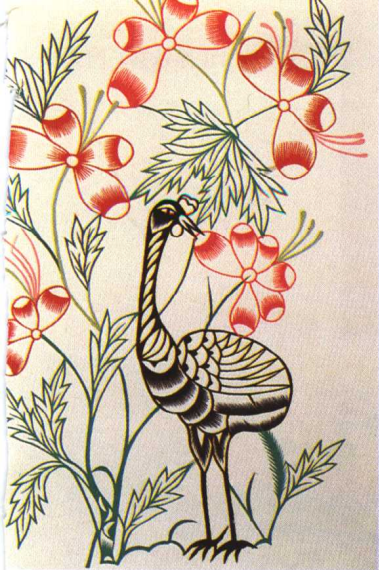
图1 鹤（山东莱州）拼色剪纸