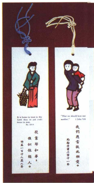
图 17 剪纸书签（山东牟平）