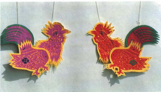
图 16 斗鸡（山东昌邑王锡芝）