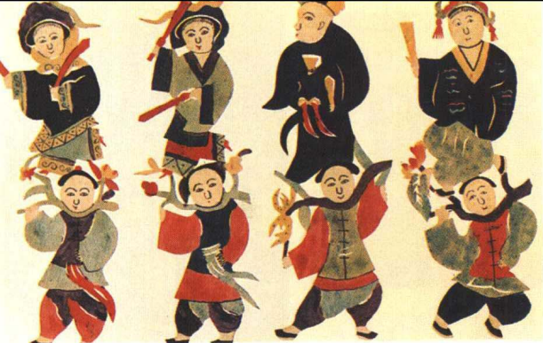
图 14 金山寺站钎（清代山东牟平孙绪民）勾绘剪纸