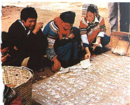
图11 出售花样 (云南元阳县彝族)