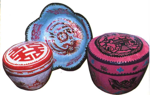
图12 纸斗笠箩 (山东荣成)