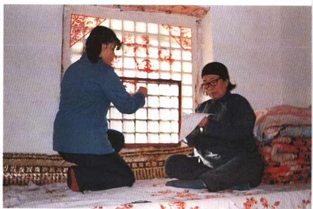
图13 学剪纸 (山东莱州)