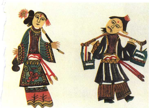
图3 锯大缸（山东莱西）勾绘剪纸