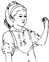
第二拍左手半握拳，掌心向内，手腕平直，前伸至鼻前方。