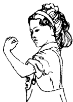
第三拍左手腕向 面部甩动，还原。