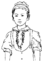
第八拍左臂垂下直，五指伸直。