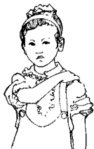
第一拍右臂弯曲， 五指平放在左肩上。