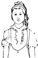
第八拍左臂垂下， 五指伸直。