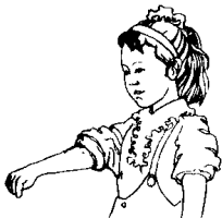
第三拍右小臂向右前方平行甩动，还原。