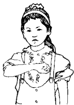
第二拍右手握拳， 放至胸前，掌心向下。