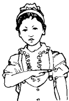
第三拍五指伸直， 掌心向下。