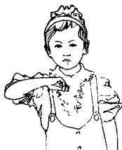
第二拍右手半握拳，向下至胸前，掌心向下。