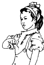
第二拍右手半握拳，下放至胸前，拳心向下。