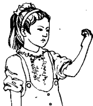
第二拍左手半握 拳，掌心向内，手腕 平直，前伸至鼻前方。