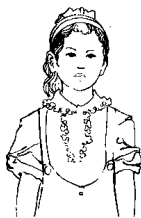
第八拍右臂垂下， 五指伸直。