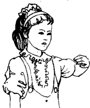
第三拍左肘部先 左后右摆动一次。