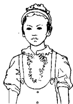
第八拍左臂垂下， 五指伸直。