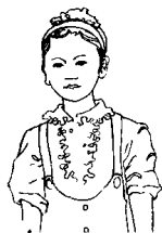
第八拍右臂垂下，五指伸直。