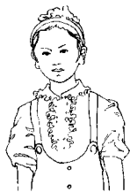
第八拍右臂垂下，五指伸直。