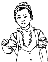
第三拍右手臂保持三角形，向下、向右、向上划圈。