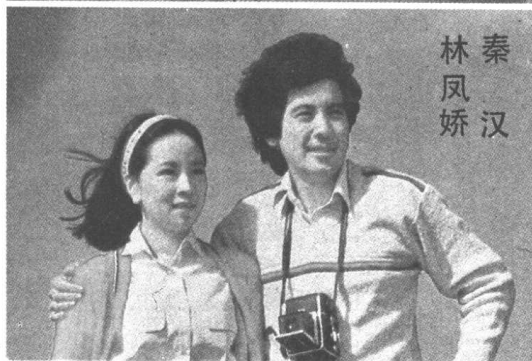
秦 汉 林 凤 娇