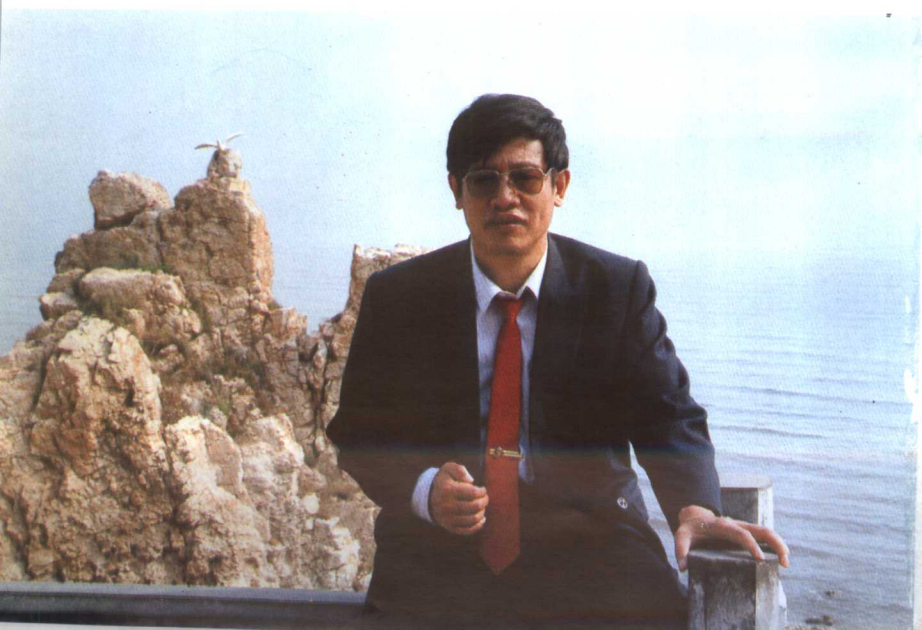
1994 年北戴河疗养留影