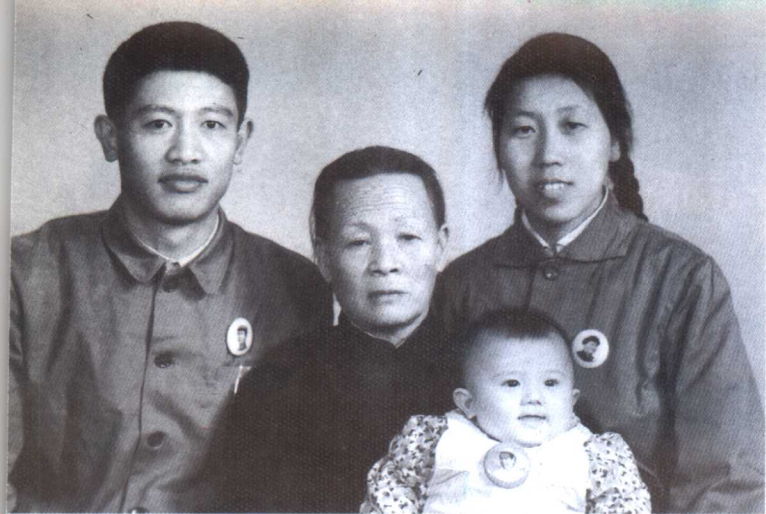
1971 年与母亲、妻子、长女合影