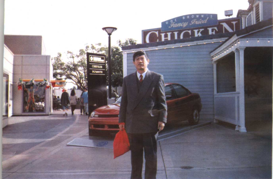
1994年摄于美国洛杉矶