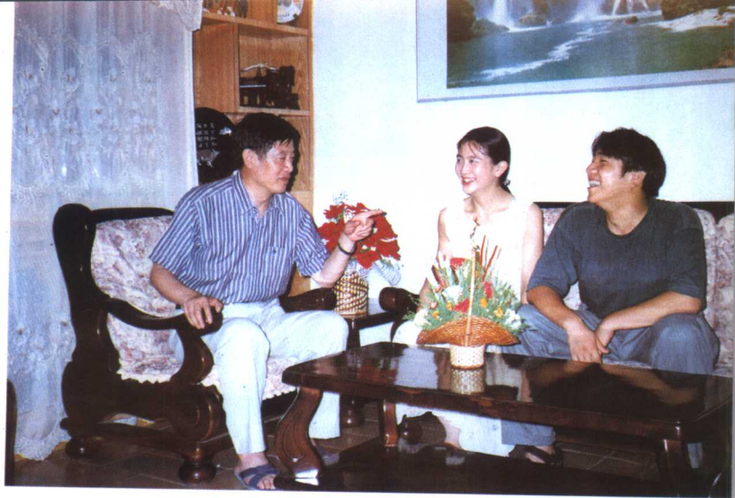
向女儿、儿子讲解法律