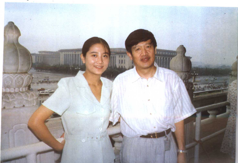
1996年与女儿登天安门