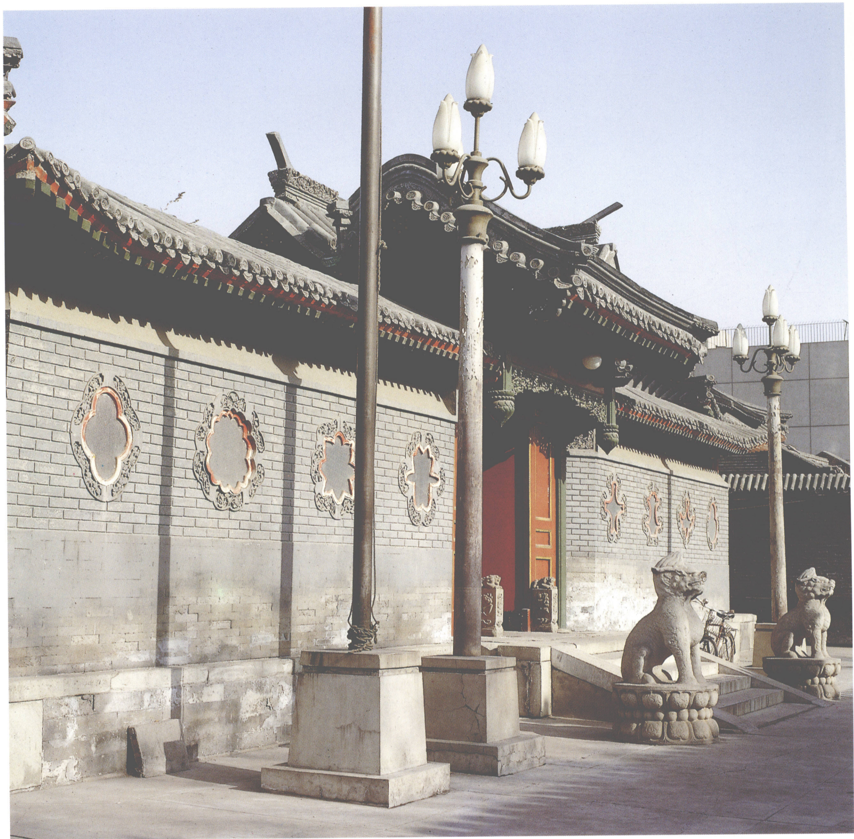
2 北京東城區禮士胡同某宅中門／北京