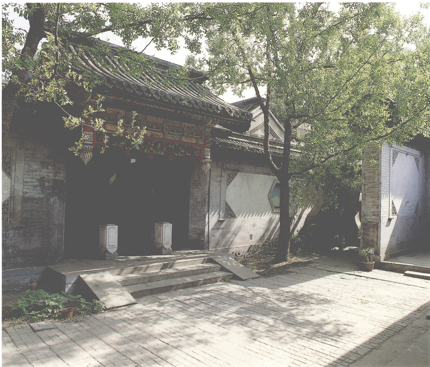
4 北京文昌胡同程宅照壁及垂花門／北京