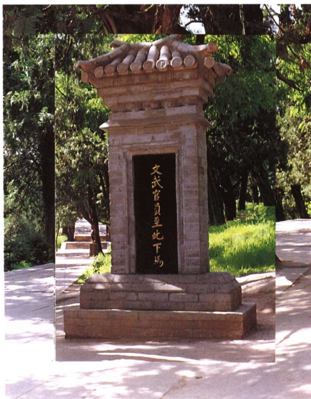
“文武官员至此下马”碑

距黄帝陵约 400 米的神道旁，有一座明嘉靖年间垂立的石碑（右图），上刻“文武官员至此下马”。古代祭陵者均须在此下马，下轿。