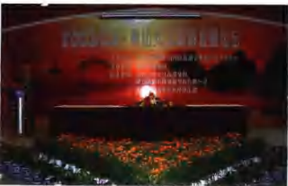
2003年中国·黄山人文旅游发展论坛