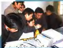
计算机专业学生在做实验

在市委、市政府实施人才战略和“343”行动计划重大战略决策的鼓舞下，黄山电大迎来了难得的发展机遇。全校教职员昂扬精神，团结一心，扎实开展工作，积极为黄山市培养更多“留得住、用得上”的高等实用型专门人才，为实现“三县”目标建设美好家园做出应有贡献。