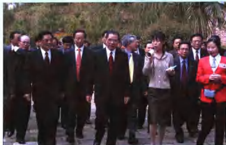
4月9日至10日越南共产党中央总书记农德孟到黄山市考察访问。