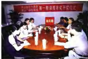
黄山广播电视报社适时举办活动。