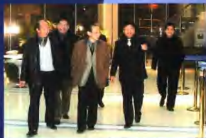
汪光焱副行长、姜志耘副行长陪同李志明市长视察黄山分行。

存款余额12.5亿元,贷款不良率7.09%,2003年黄山分行荣获中国银行业监督管理委员会授予“安徽省创建金融安全区先进单位”称号,成为安徽省金融系统首家地市分行金融安全区先进单位。