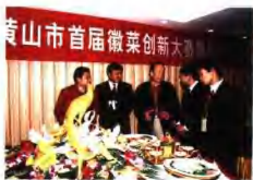
黄山市首届徽菜创新大赛