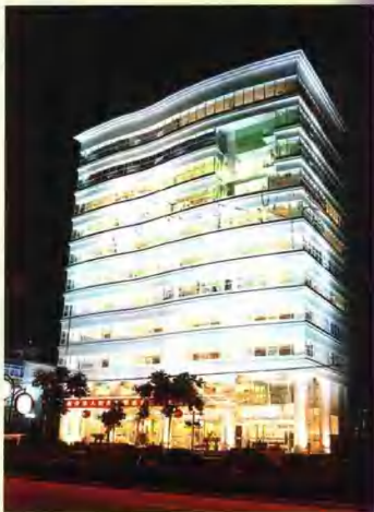
安广网络黄山市分公司外景