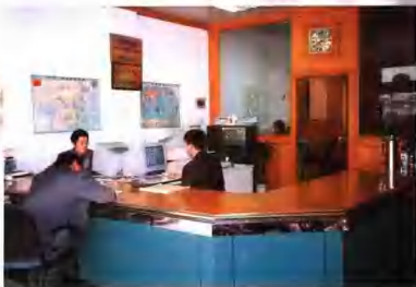
公司客户服务中心

达的实收保费任务。全年保持高速发展态势。其中上半年提前30天实现“时间、任务”双过半，全年提前30天完成全年任务，又一次达到平安财险成立以来的最好成绩。出色的业绩得到省公司领导称赞，市委、市政府领导也多次亲临公司指导工作并祝贺取得的成绩。