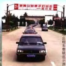
出租车整顿巡逻示游