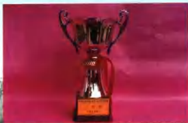
荣获全国文通系统“五四”普法电视大奖赛三等奖