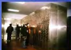
黄山市险兼开办的保险柜业务