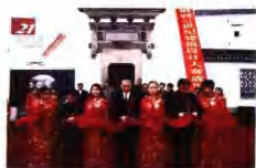
徽派古建筑展暨“21世纪新徽派设计大赛”成果展