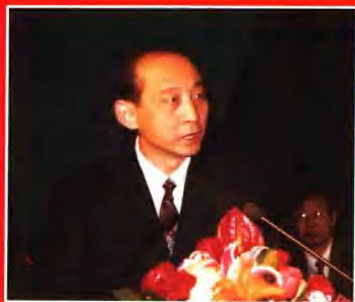
张宏伟当选为黄山市人民政府市长。