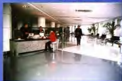
开放式柜台营业的二楼大厅