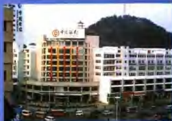
矗立于黄山市得山甲路的中行黄山市分行大楼

中国银行黄山分行自2003年2月8日,现内设部室14个,“一级分行”管理模式,现有员工260名。在黄山市委、市政府和当地党委政府的关心支持下,分行党委一班人始终坚持以科学发展观为指导,坚持“薄利多销”的公司治理机制,积极开拓,稳健经营,逐步发展成为国内一流商业银行。特别是近三年来先后荣获“中国银行业最佳服务奖”,扩大营业面积,改善营业环境,增加营业品种,增加人民币、外币存款、贷款业务,国内、国际、贸易、信用证业务,住房按揭等消费信贷业务,代客理财,投资理财等业务都得到了长足的发展。2003年本外币