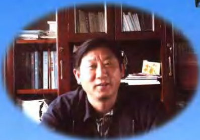
市交通局局长、党组书记钱新廋