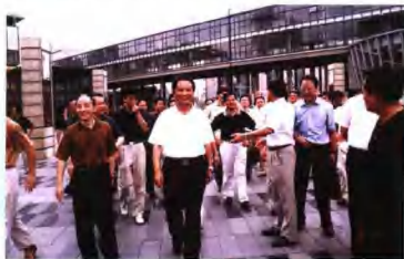
9月25日，以市委书记王启敏为团长，市委副书记，代市长李宏鸣和市委副书记，市政协主席杨立威为副团长的黄山市党政代表团赴浙江省学习考察。此后，全市开展了“主动融入浙江经济带和长三角经济圈，掀起黄山新一轮发展新高潮”大讨论。