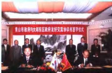
10月25至27日，韩国大邱广域市东区政府代表团访问黄山市，26日双方签订友好交流协议书。