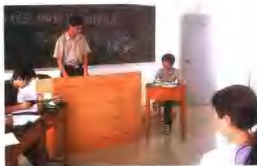
学生进行毕业论文答辩