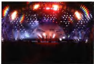
锦绣黄山之夜大型综艺晚会