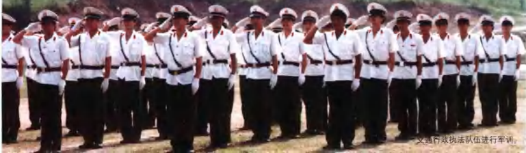
交通行政执法队伍进行军训