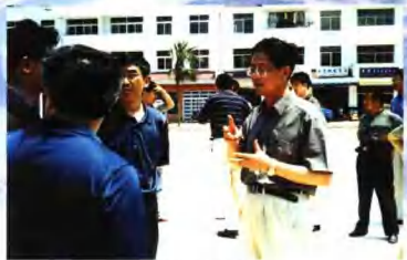
市领导检查公路建设。