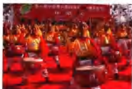
《徽风浩荡》——威风锣鼓