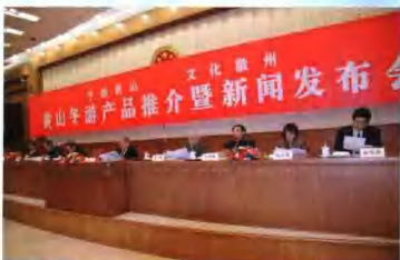
12月28日，黄山市政府和中国旅游报社在人民大会堂全国人大常委会会议厅共同举办黄山冬游产品推介暨新闻发布会。