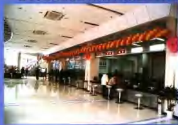
宽敞明亮的二楼营业大厅