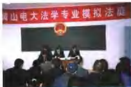
学生正在进行模拟法庭实践

始创于1978年的黄山广播电视大学是黄山市市属高校，主要开展中央电大的成人“开放教育”本、专科学历教育，并与浙江大学、东北财经大学、北方交通大学、安徽师范大学等高校合作开办本科、研究生层次的学历教育。同时开展计算机应用、实用英语等各类非学历教育培训和继续教育。