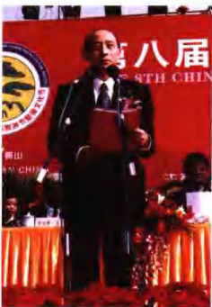
市委副书记、市长、旅游节暨徽文化节组委会执行主任李宏鸣主持开幕式。