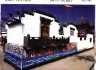
《徽风浩荡》——“皖南古民居”彩车