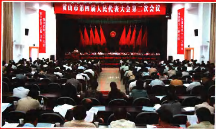
黄山市人民代表大会第二次会议于2003年9月1日在屯溪召开。