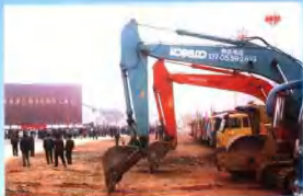
全市第二条高速公路屯汤高速公路开工