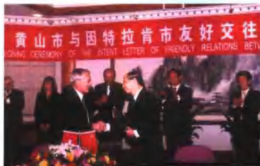
10月13日至16日，黄山姊妹山——瑞士少女峰所在地因特拉肯市政府代表团访问黄山市，双方签订友好交流协议书。