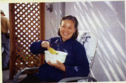
农民出身 舍不得浪费粮食