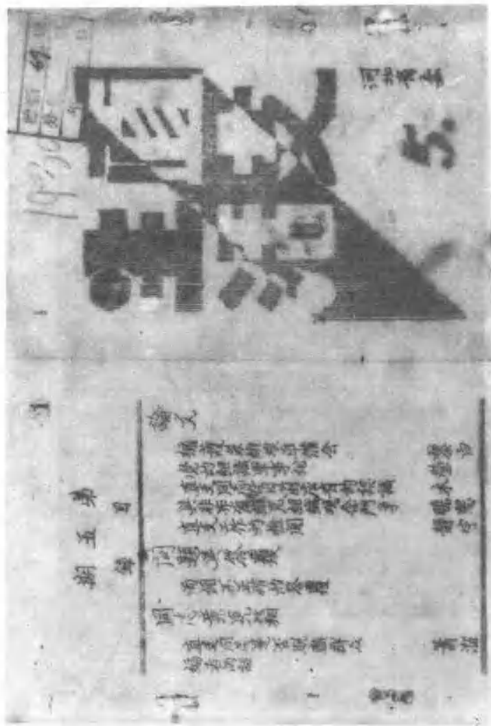
《直支生活》系中共顺直省委创办的机关内部刊物，1930年5月创刊，同年8月停刊，共出5期。