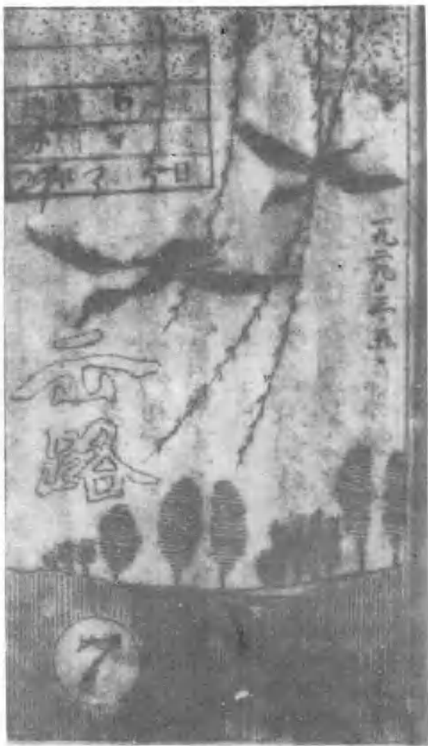
《出路》系中共顺直省委创办的第二个机关刊物，1928年11月出版第1期，1929年8月停刊，共出版13期。