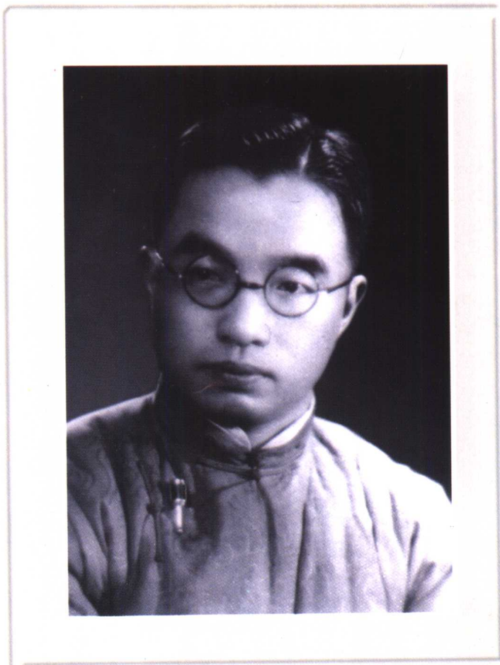
朱自清摄于 20 年代