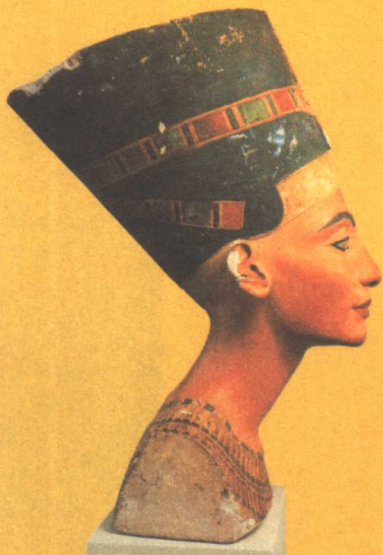
奈费尔提蒂王后胸像 新王国 第18王朝 公元前1360年