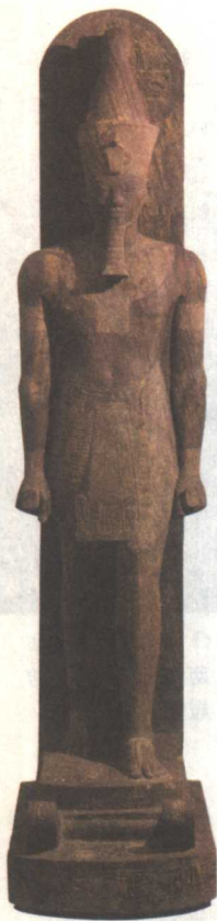
◎ 阿蒙霍特普三世 新王国 第18王朝 公元前1380年