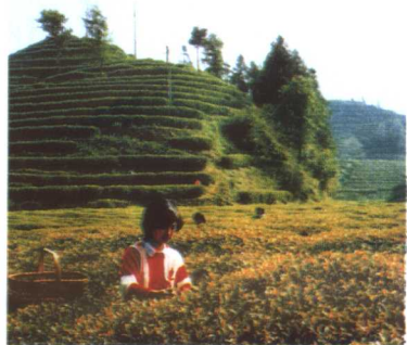
彩图4 安徽祁门茶园