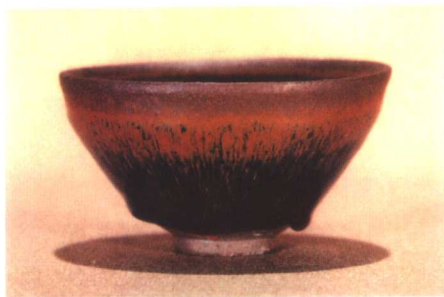
彩图5 宋代建窑兔毫盏