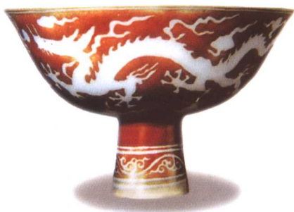
彩图7 明永乐红地白龙高足杯