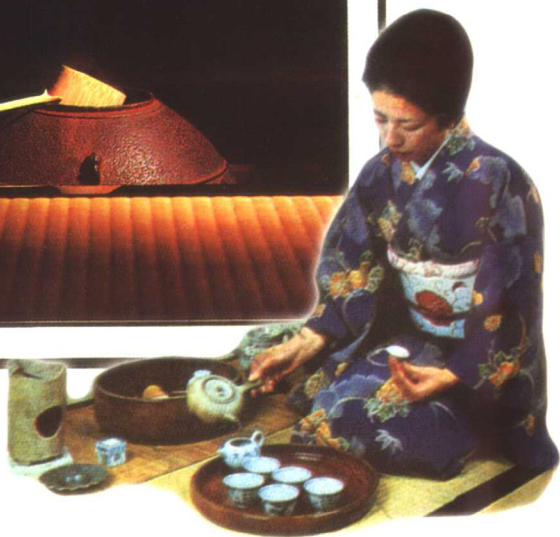
彩图 13 日本茶道 (一)