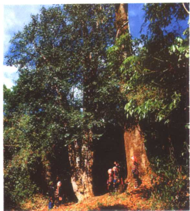
彩图1 云南省西双版纳巴达的野生古老大茶树 (树龄约1700年)