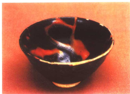
彩图6 宋代吉州窑玳瑁釉茶盏