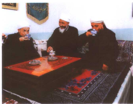
彩图 15 回族人饮茶