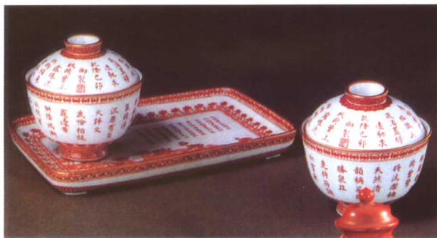
彩图8 清乾隆御制诗款茶具