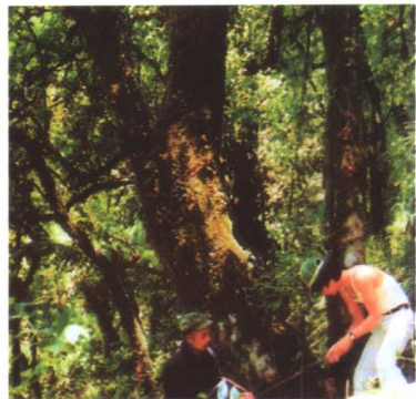
彩图2 云南省金平县古茶树 (树高13米, 干径1.8米, 树龄1000多年)