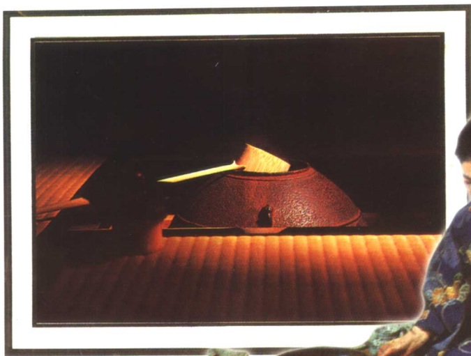
彩图 14 日本茶道 (二)