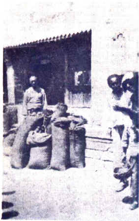
街東山中縣德綏 麥賣