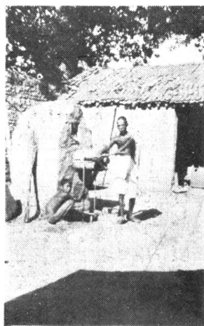
水汲(上) 村家王縣南渭