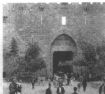
犹太人曾建立了辉煌的文明

犹太人认为，巴勒斯坦是一块天经地义属于他们的神圣领土，因为这是神赐予他们的。根据《圣经·创世记》记载，希伯来人的始祖亚伯拉罕在75岁那年，听到了上帝的召唤。上帝吩咐他离开故乡，并许诺把巴勒斯坦作为他后代的居地，但前提是希伯来人要经受400年的苦难和流离。后来亚伯拉罕的孙子雅各率部落在埃及定居并迅速繁衍，引起埃及王的恐慌，对他们严加管制。此时神谕摩