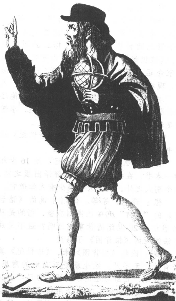
图1 诺查丹玛斯画像