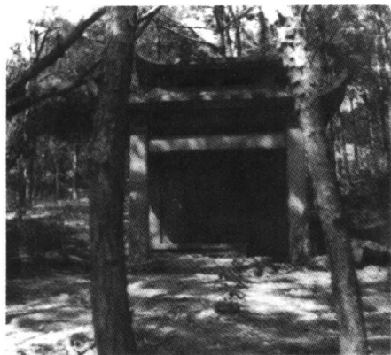
林大钦墓地(潮州市东山湖)