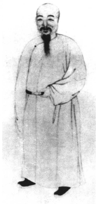
清乾隆四年状元庄有恭画像