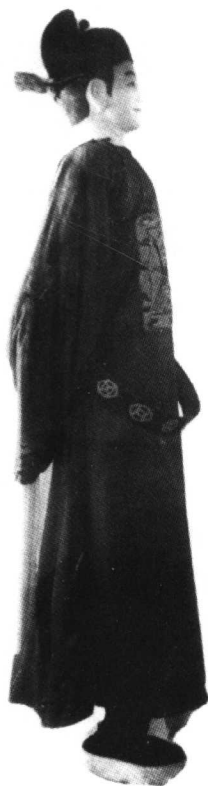
唐代状元莫宣卿塑像