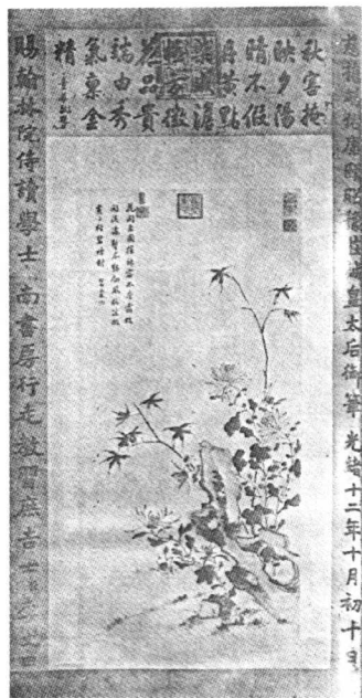
慈禧太后賜給李文田的墨宝