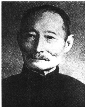
1957年,83岁的清代探花商行鑒