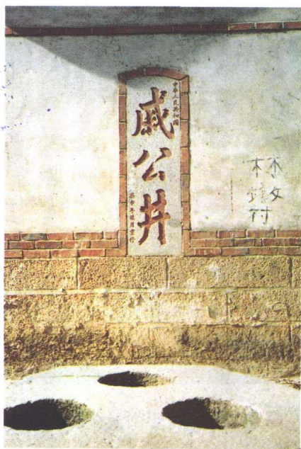
福建省莆田市黄石镇 林墩村威公井