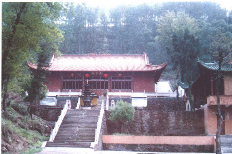
浙江省临海市白水洋镇戚公祠