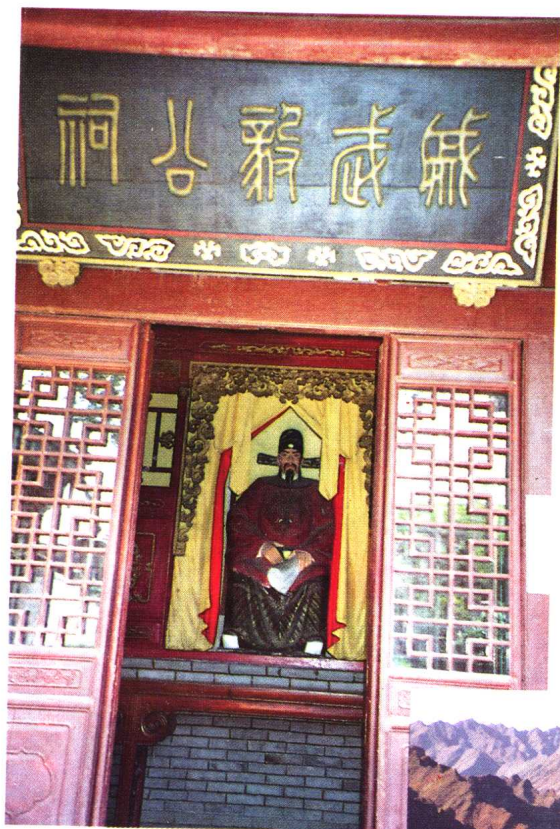
山东省蓬莱市 市区威武毅公祠