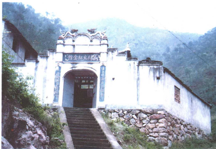
浙江省临海市白水洋镇上峰村头的戚继光纪念馆