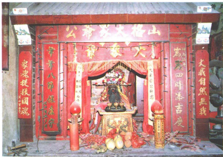
福建省平和县山格镇慈惠宫内的大众爷像及神龛