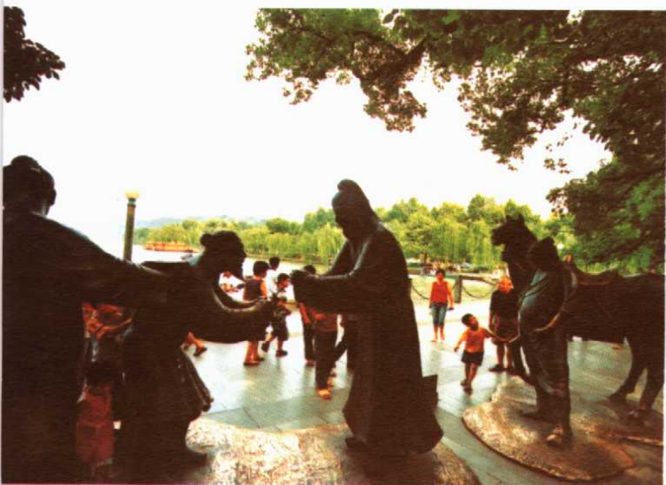
惜别白公群雕〔黄乐康 摄〕

之号，天竺有灵运之亭，飞来有慧理之塔，孤山有天嘉之桧，然华艳之迹，题咏之篇寥落莫睹。逮于中唐，而经理渐著。”唐建中二年至兴元元年间（781—784），杭州刺史李泌开“六井”，引湖水，结束了西湖的咸水时代，这也是史载的首次对西湖的治理。苏轼说：“杭之为州，本江海故地，水泉咸苦，居民零落。自唐李泌始引西湖水所凿六井，然后民足于水，井邑日富。”唐长庆年间（821—824），白居易任杭州刺史。他排除种种阻力和非议，重修“六井”，并发动民工加高湖堤，修堤筑闸，增加了湖水容量。他在《钱塘湖石记》文中说：“凡放水溉田，每减一寸，可溉十五余顷。每一复时，可溉五十余顷。”“其笕之南，旧有缺岸，若水暴涨，即于缺岸泄之。又不减，兼于石函内笕泄之，防堤溃也。”从此，杭州附近的千余顷农田得免凶年。同时，白居易更以诗人的审美情趣，种荷植树，让苍白单调的西湖戴上了美丽的花环，使西湖平添了丰韵。“自别钱塘山水后，不多饮酒懒写诗”，白居易热爱杭州，犹爱西湖风景，他写了不少歌咏杭州和西湖的优美诗词，特别以《忆江南》一词最为著名。西湖的景色，经他的妙笔点