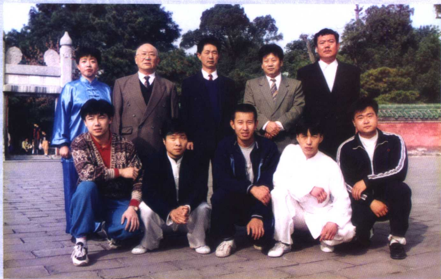
华园武术培训中心主 要负责人及学员合影