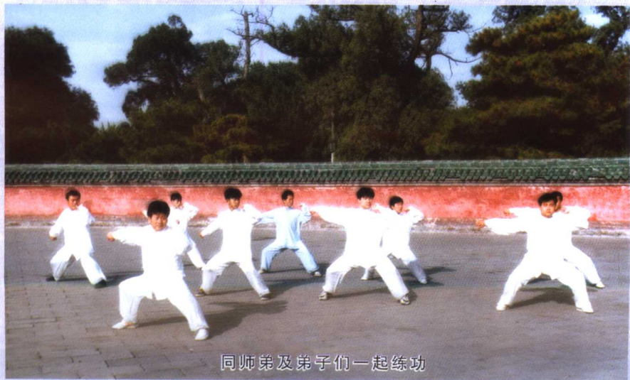
同师弟及弟子们一起练功