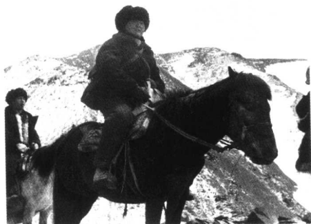
海拔 5200 米的唐古拉山