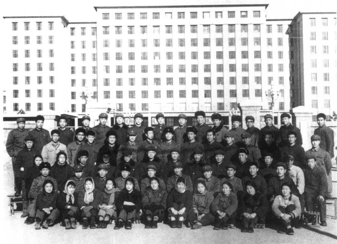
清华大学建工系参加建设青藏铁路的同学合影