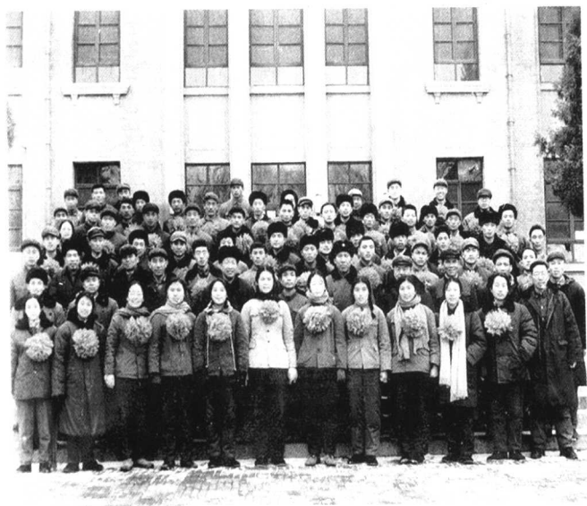
工物系赴“三省一路+解放军”合影