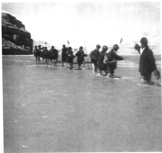
趟过长江黄河的源头