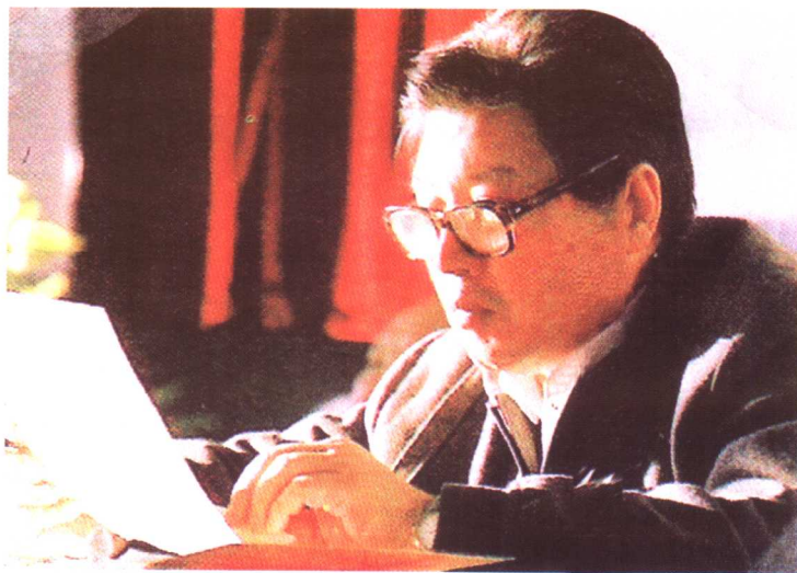
林声 原辽西青干校负责人,离休前曾任辽宁省副省长、省政协副主席。