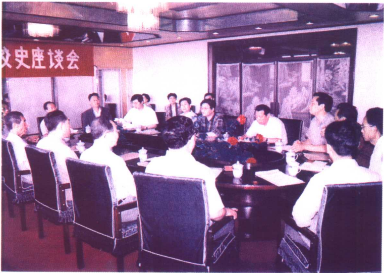
《辽西青干校校史座谈会》与会成员合影。