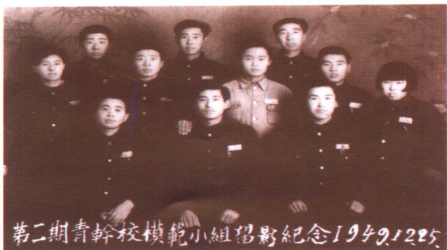
辽西青干校第二期模范小组全体学员合影。