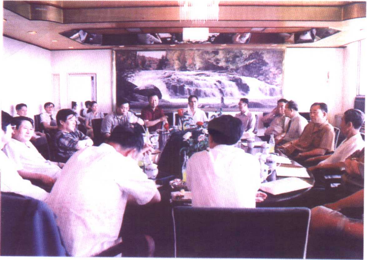
《辽西青干校校史座谈会》与会成员合影。