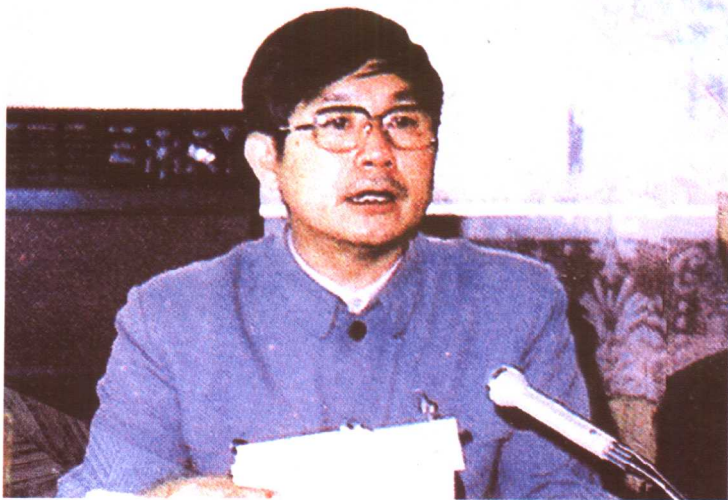
孙奇 原辽西青干校学员、离休前曾任中共辽宁省委副书记、省政协主席。