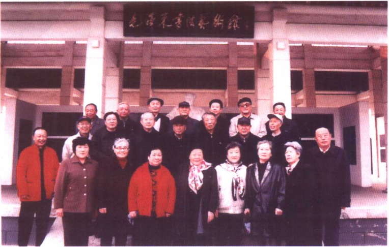
出席辽西青干校(团干班)校友座谈会的全体成员合影。2004年9月1日于盘锦市