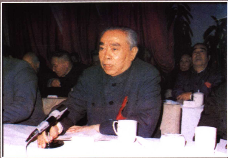
全国人民代表大会副委员长朱学范参加我校三十周年校庆（1985年）