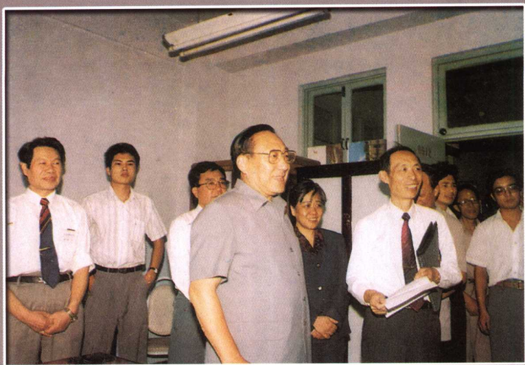
李岚清副总理来我校看望教师并参观实验室（1994年教师节）