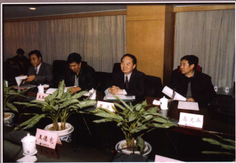
教育部周济副部长视察我校（2002年）