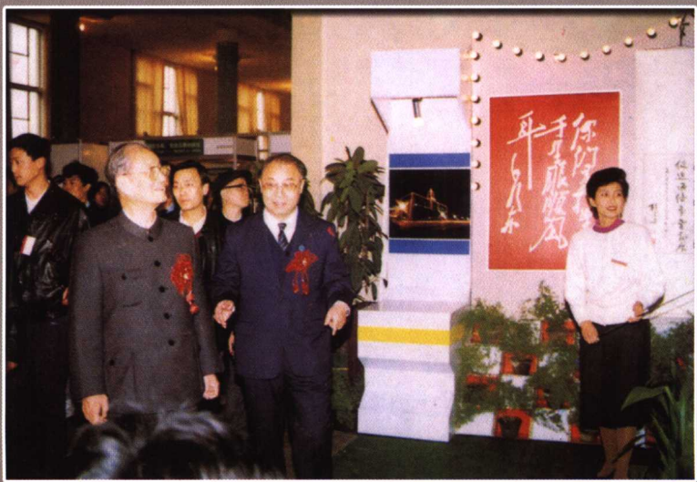
中共中央政治局常委宋平参观我校科技展览（1990年）