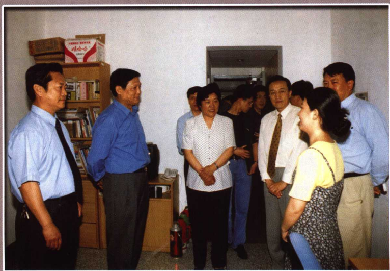
刘祺来校视察并看望学生（2000年）