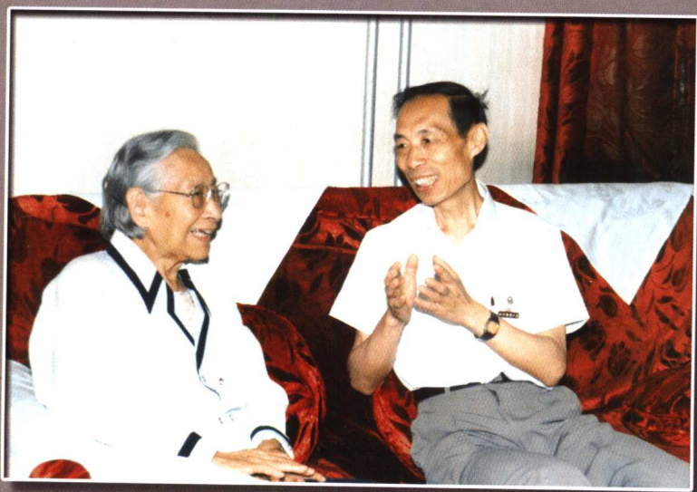
全国人民代表大会副委员长雷洁琼来我校指导工作（1995年）