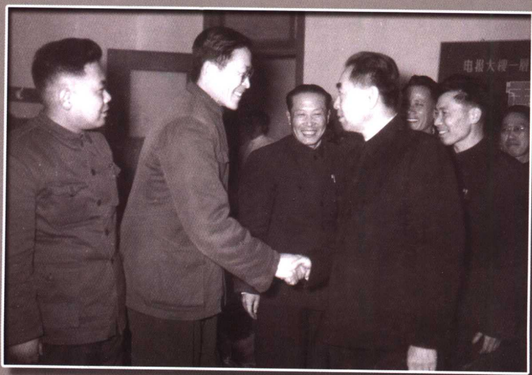
周恩来总理视察学校电报大楼（1958年）