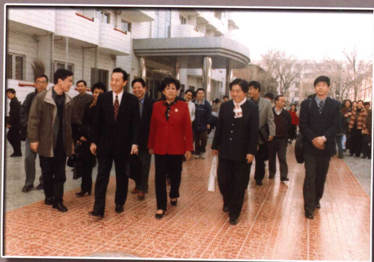
教育部部长陈至立视察我校（2002年）