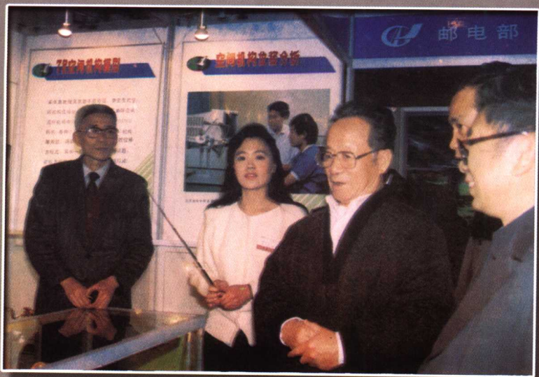
全国政治协商会议副主席谷牧在展览会上听取激光通信的介绍（1990年）