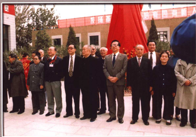
曾庆红、吴基传、罗青长、伍绍祖参加李白烈士塑像揭幕典礼（1995年）