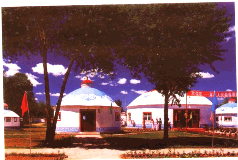
具有浓烈草原风情的蒙古包