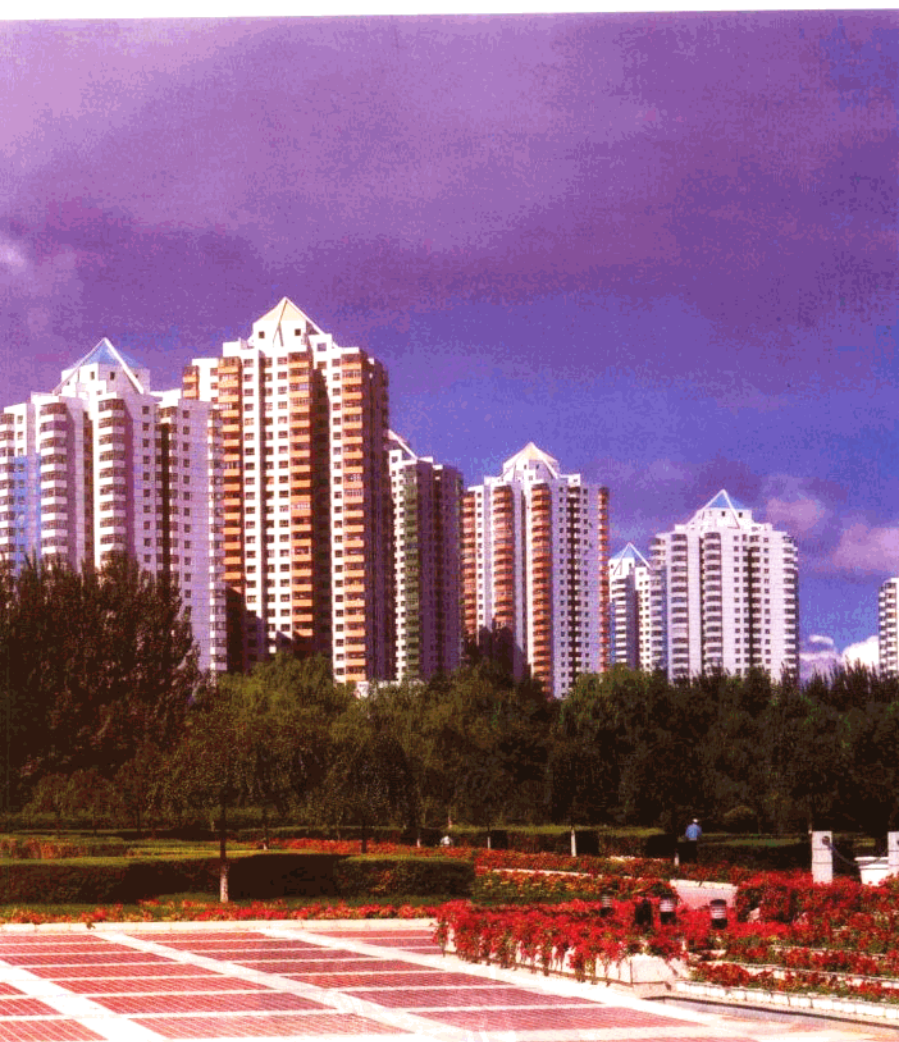
铁人广场彰显油城特色