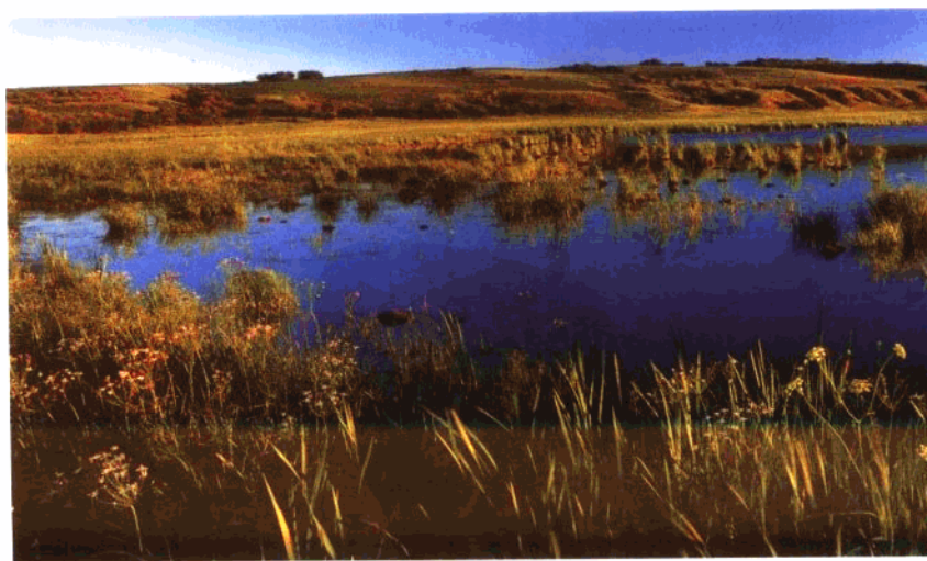
广阔无垠的湿地景观