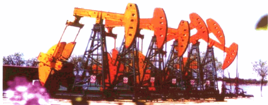
油田丛式抽油机井