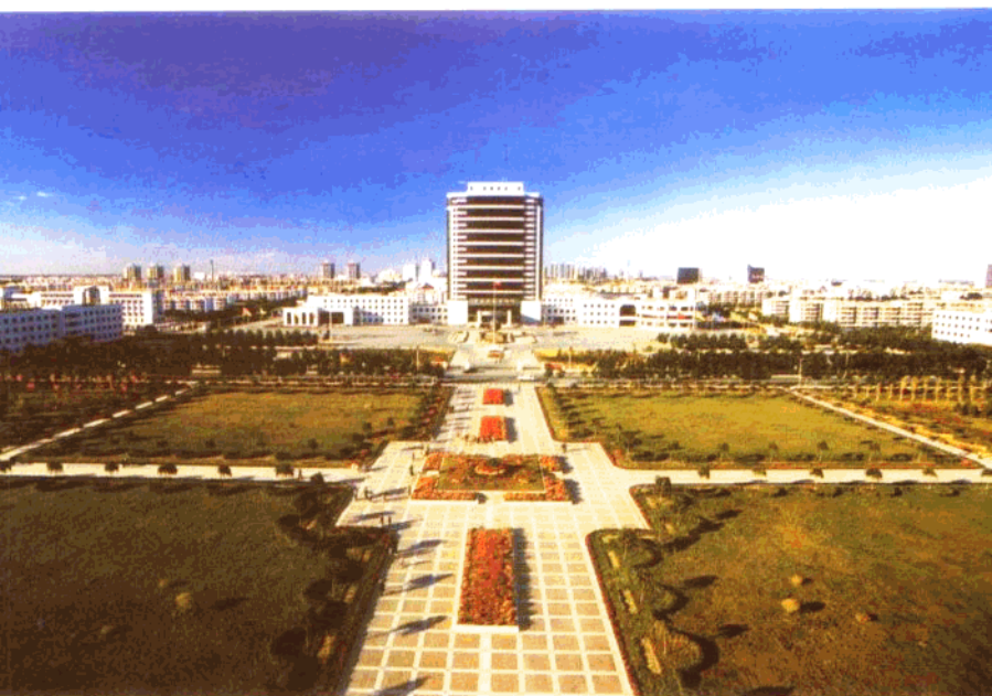
石油管理局办公楼