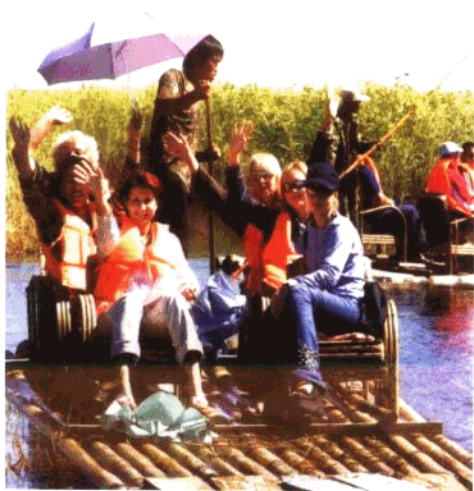
回归自然带来了无限的欢娱