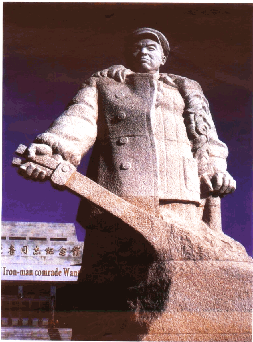
“铁人”王进喜同志纪念馆