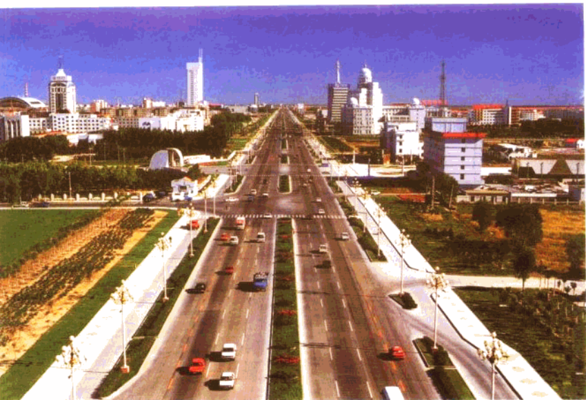
横贯油城的世纪大道