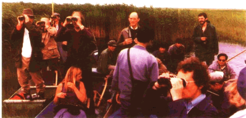
到湿地观鹤的旅游团与日俱增