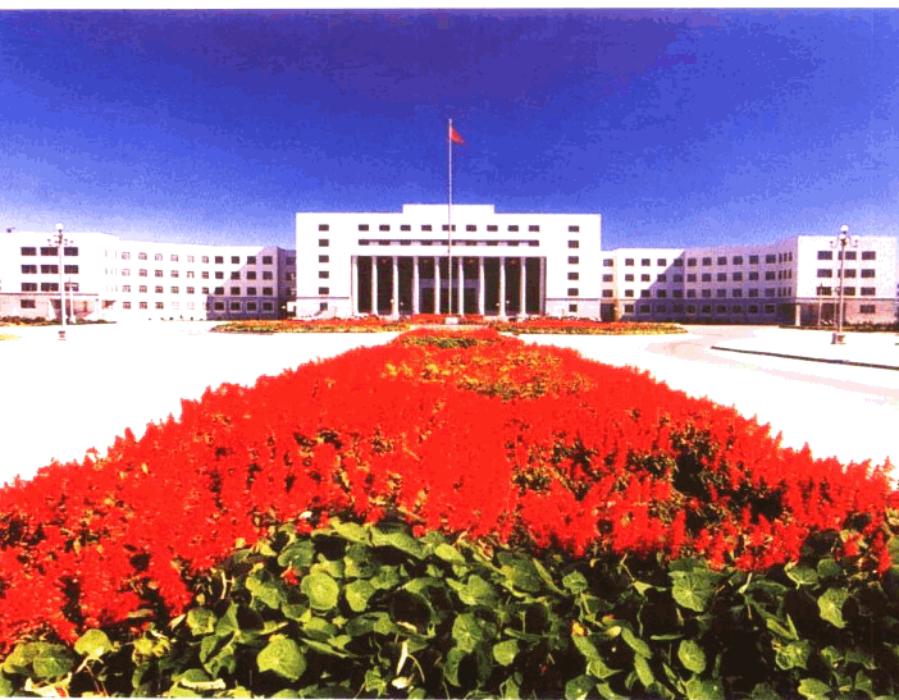
市委、市政府办公楼