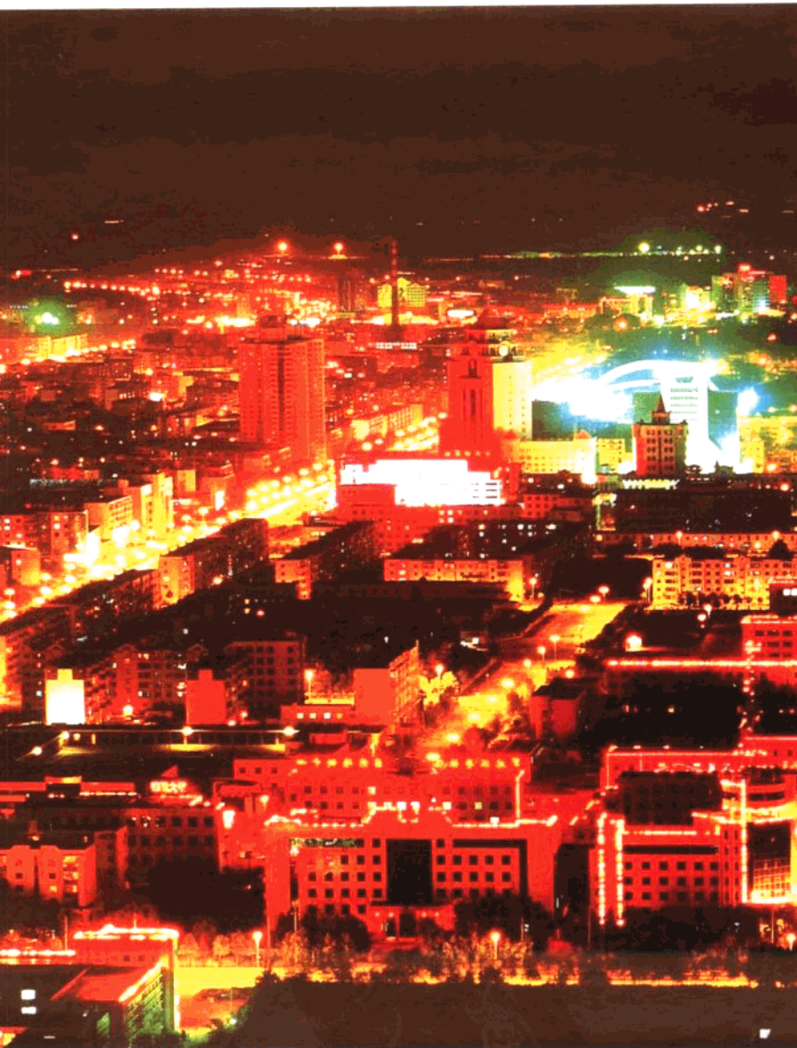
祖国北疆的璀璨明珠——大庆市