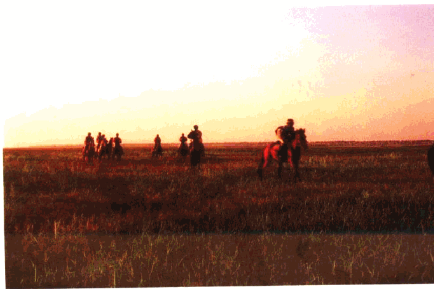
在广袤的草原上策马驰骋