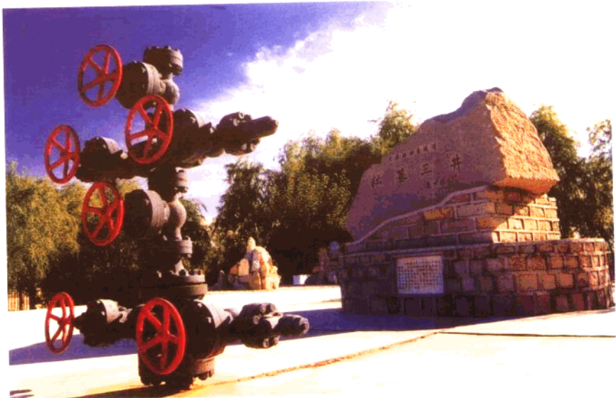
大庆油田发现井——松基三井