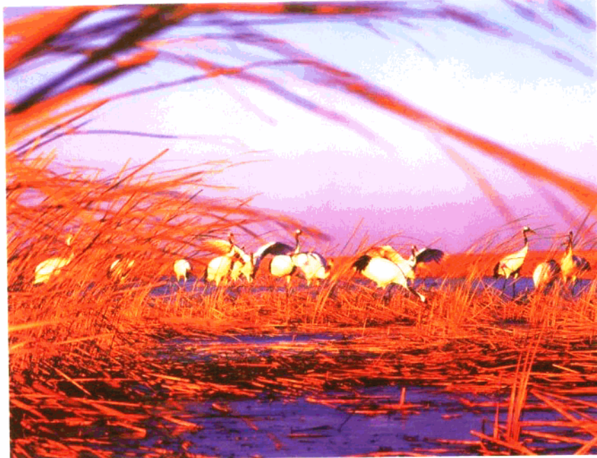
生活在自然保护区的丹顶鹤群