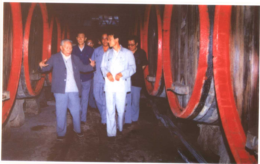
在吉林通化调研国有企业发展问题(1987)