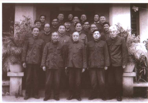
在广东省佛山市组织召开 中国财政学会、中国会计 学会成立大会(1979)