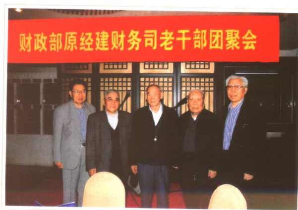
与财政部经济建设财务司老同志重聚(2005)