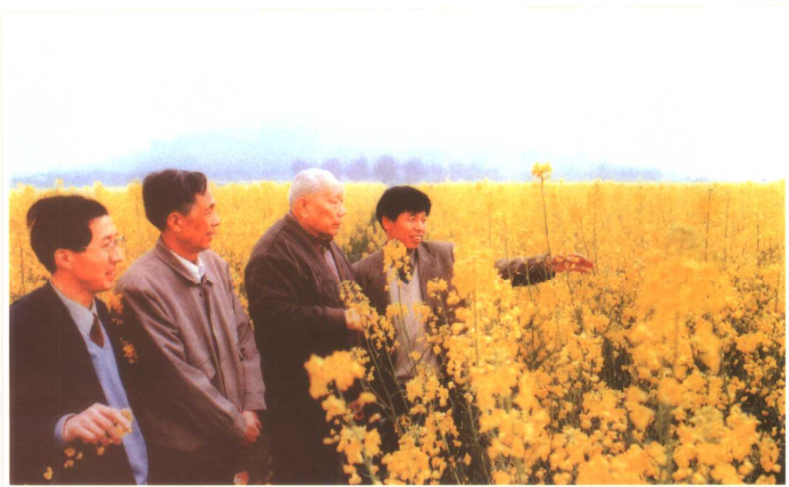
多次深入江苏省苏州市吴中区调研城乡一体化问题(1988)