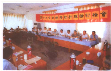
主持全国第四次经济杠杆 理论研讨会 (1988)