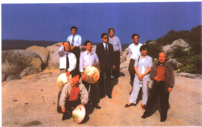
研讨海南特区的发展(1996)