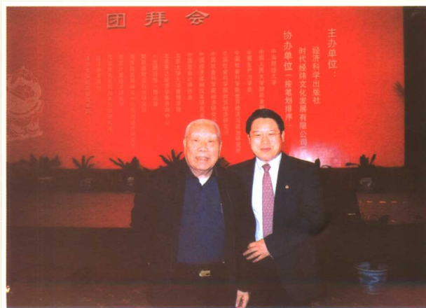
与财政部李勇副部长在经济学界春节团拜会上（2003）