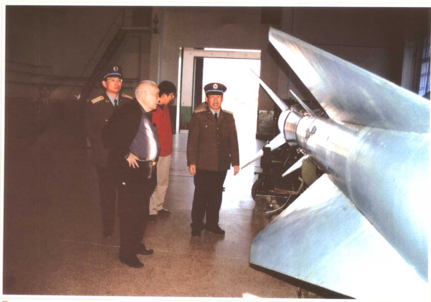
在我国某军事基地调研国防财政问题(2002)