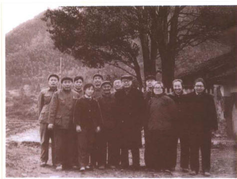
在沙州坝编写《革命根据地财政经济史长编》 (1979)