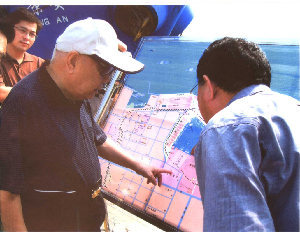
在海港城市日照调研新形势下对外开放问题(2004)