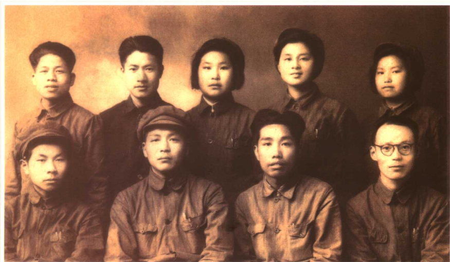
苏皖一分区专署财经处同仁在江苏如皋 (1946)