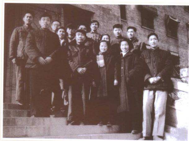
与中国人民建设银行同志合影(1960)