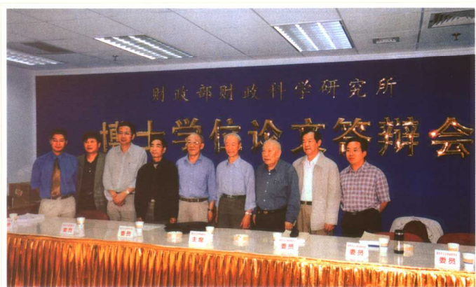
在学生的博士论文答辩会上 (2002)