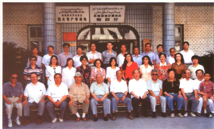
在新疆自治区调研少数民族财经问题(1995)