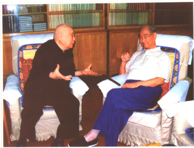
与宋平同志讨论新世纪新形势新任务(2005)