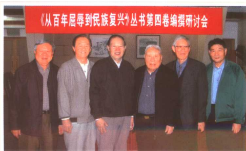
财经史丛书《从百年屈辱 到民族复兴》编委会部分 成员合影 (2004)