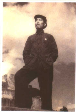
华东军政委员会财政部计划处处长 (1951)