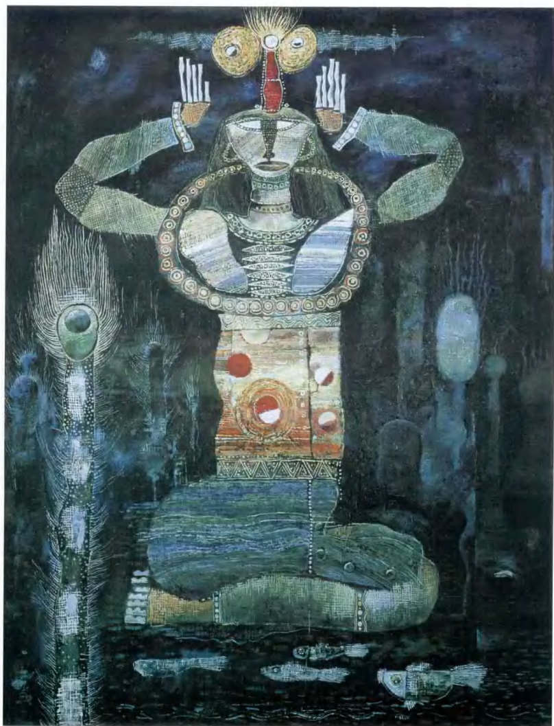
水里浮过来的 54×73cm 张昶 白族(1980版) 指导教师:刘秉江