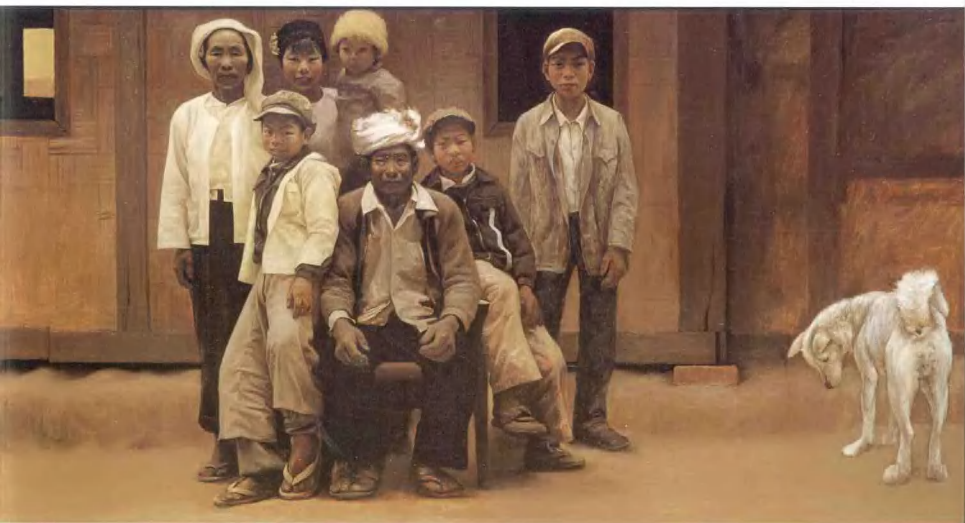
家人 170 × 100cm 白美 鄂伦春族 (1980级) 指导教师: 刘永江