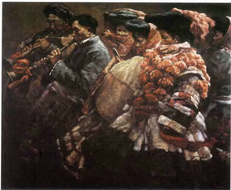
唢呐声声过山梁 150 × 180 cm 马投 回族 (1980级) 指导教师: 刘秉江