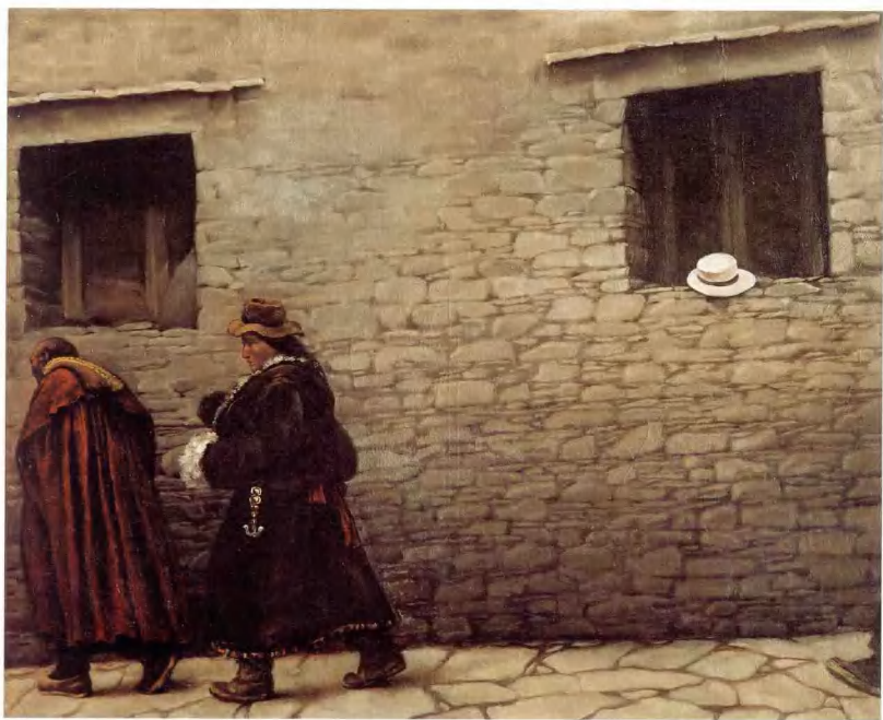
藏族组画 150 × 170cm 李昌熙 朝鲜族 (1980 级) 指导教师: 刘秉江