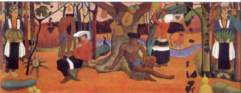
人间乐园 80 × 180cm 梁义专 壮族 (1980级) 指导教师: 刘永江