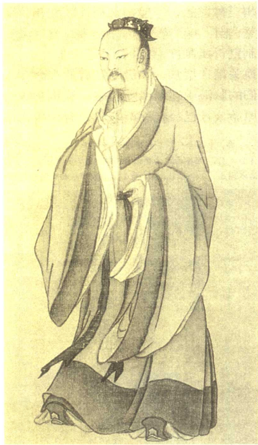
尧，姓祁，又称陶唐氏，唐尧，中国上古传说中的五帝之一，他在位时广施仁德，创后世敬仰的大同社会。

尧帝生前，宣布贤德的舜为接班人，并且让舜代替他行使管理“天下”的职责。尧帝死后，为了让尧帝的儿子丹朱