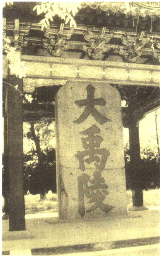
位于浙江绍兴的大禹陵，4000年来香火不断