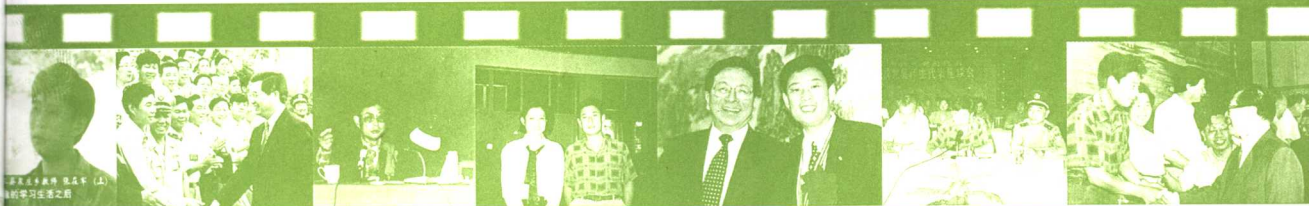
方圆老师最新“读写”辅导丛书《快乐大语文》隆重推出！