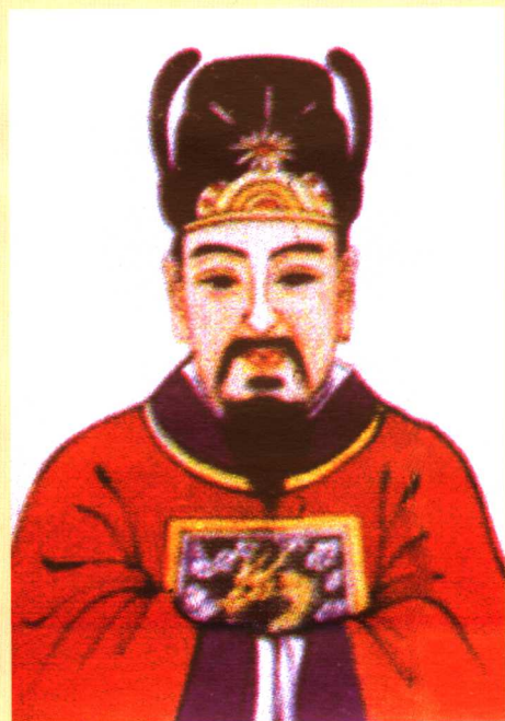
上图 南朝陈高祖皇帝—— 陈霸先（古盐陈氏谱稿） 下图 陈朝立宜都王——陈 叔明（义门大成谱稿）