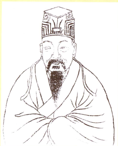
江州义门始祖宋赠晋国 公——陈旺（陈光远督 修《陈氏家乘》稿）