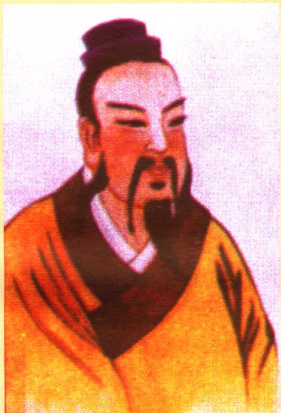
上图 陈氏血缘远祖——帝舜 (故宫博物院稿)