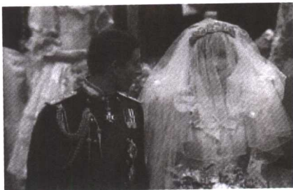
世人瞩目的世纪婚礼