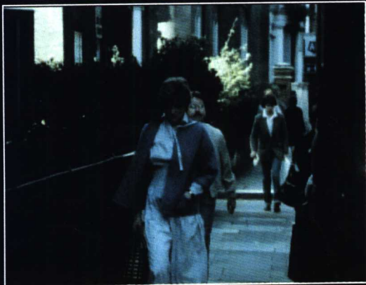
戴安娜的日常生活