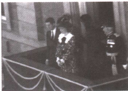
新婚燕尔没有快乐