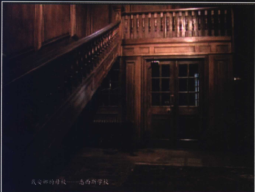
戴安娜的母校——卷西斯学校