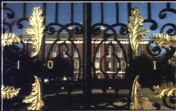
戴安娜入住的肯辛顿宫