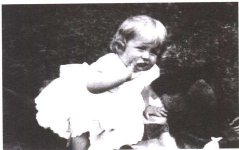
戴安娜的童年并不快乐

几年之后，父亲与雷恩结合，带给她一生挥之不去的心理阴影。戴安娜进入悉西斯学校，那年她13岁。她的祖父也在那一年