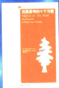
优质思考的十个习惯

如果你想获得一期《心理月刊》的赠阅，请将此卡片剪下连同您的如下信息一同寄给我们。请务必在信封上注明“赠阅”字样。此活动有效期至2006年12月30日 邮回地址：北京市建国门国际邮局100600-6655信箱 HFM《心理月刊》发行部收 邮编：100600