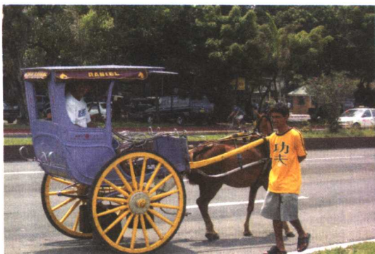
△马尼拉街头的 Kalesa 马车。