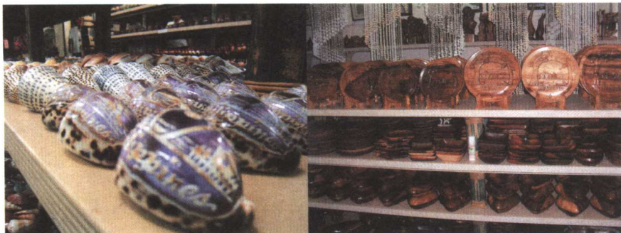
贝壳制品是菲律宾手工艺品的主打产品