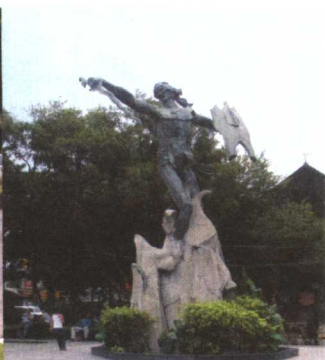
△喷泉广场旁边的拉布拉布雕像

一五二一年三月十七日,麦哲伦率领的西班牙船队到达太平洋西海岸的一个群岛,并在其中较大的一个岛屿靠岸。后来西班牙人占领了这里,将它献给了国王菲利普二世,并用国王的名字将这个群岛命名为“菲利比亚娜”,从此,菲律宾才有了现在的名字。而麦哲伦登陆的地方,就是宿务岛。