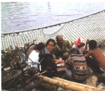
<在马尼拉湾卖太阳镜的小贩