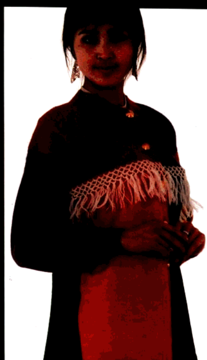
款 30 流苏长开衫