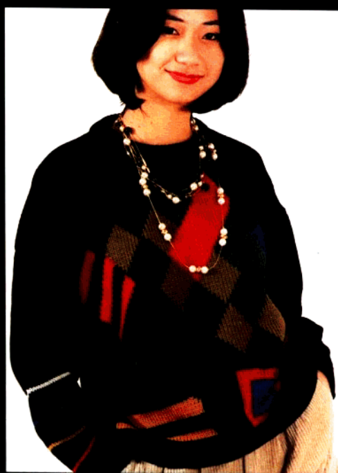
款 31 多彩色块衫