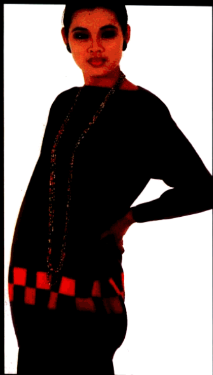
款 29 一字领淑女衫