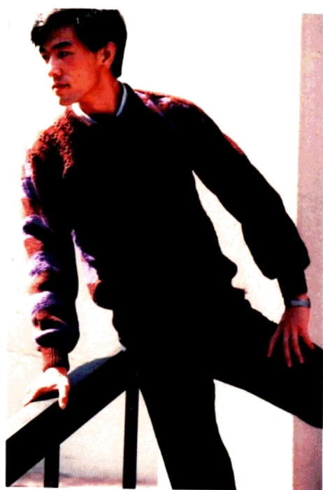
款 20 几何棒针男套衫