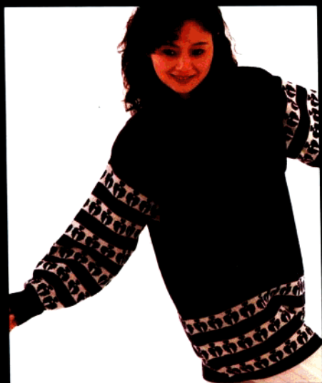
款 17 哈爱中长套衫