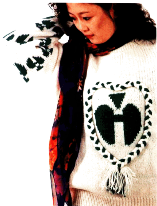
款 22 哈爱辫子衫