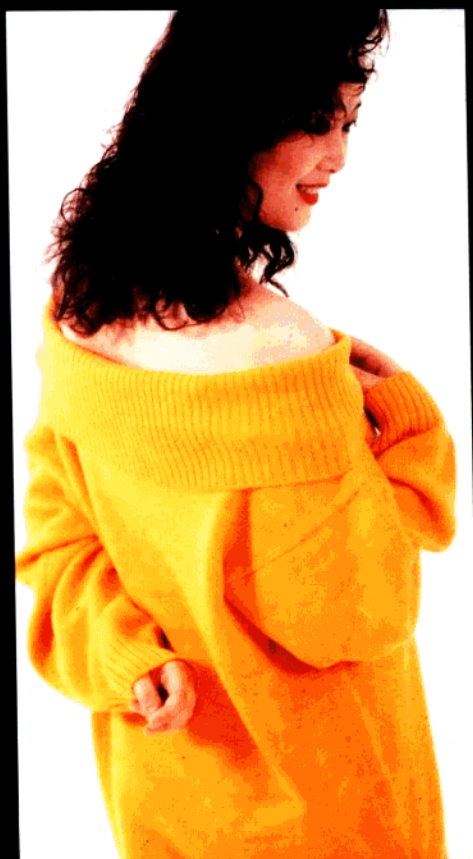
款 18 大盆领女套衫