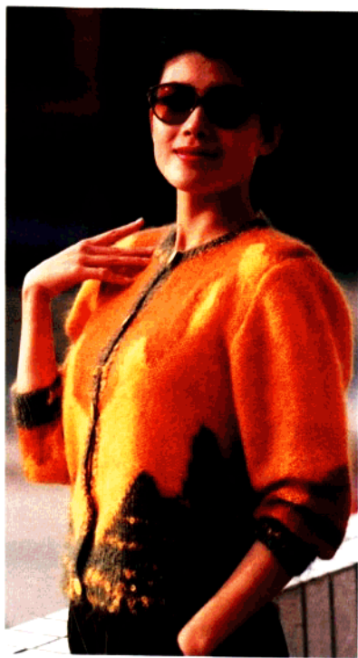
款 21 淑女衫