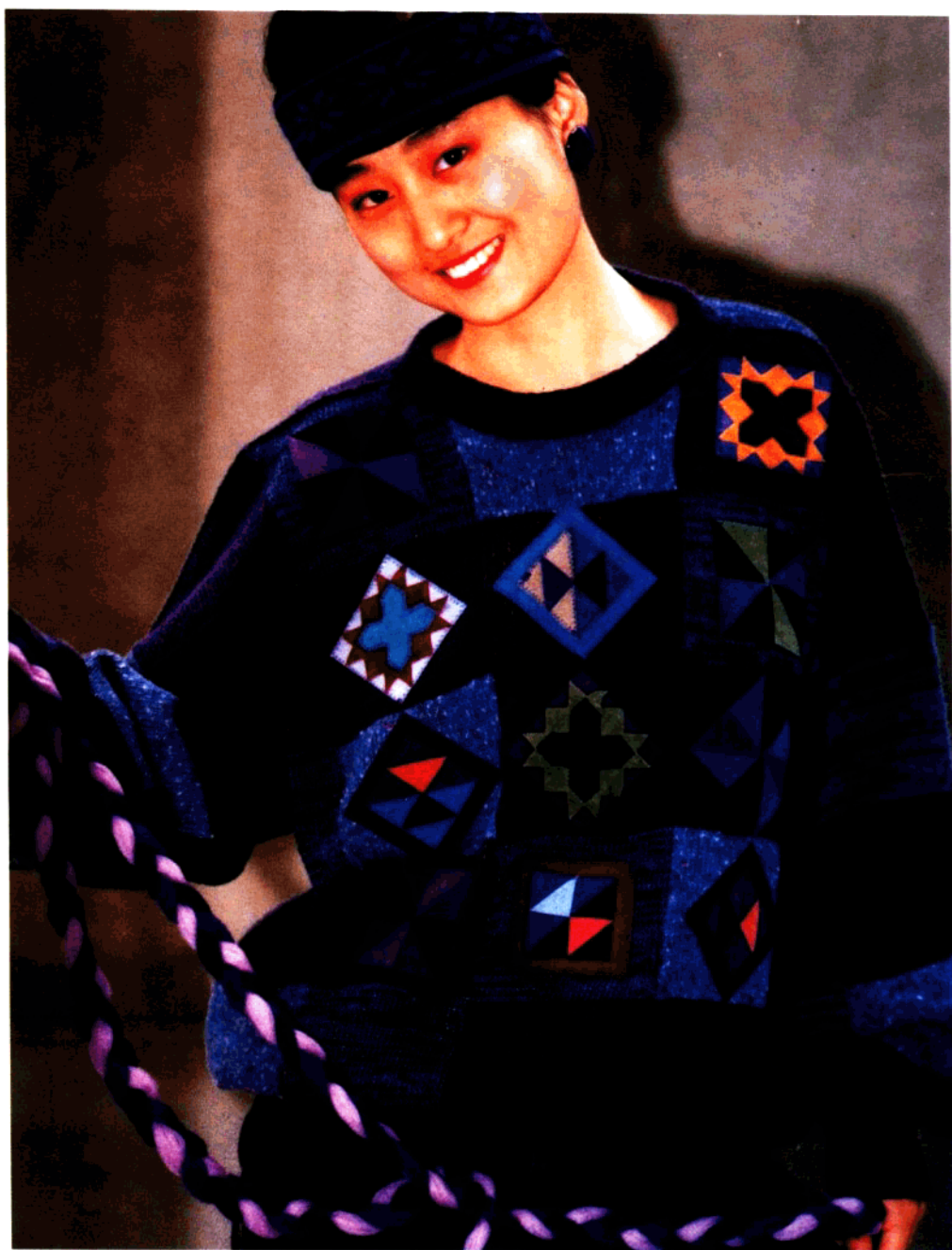
款 6 贴皮图案衫