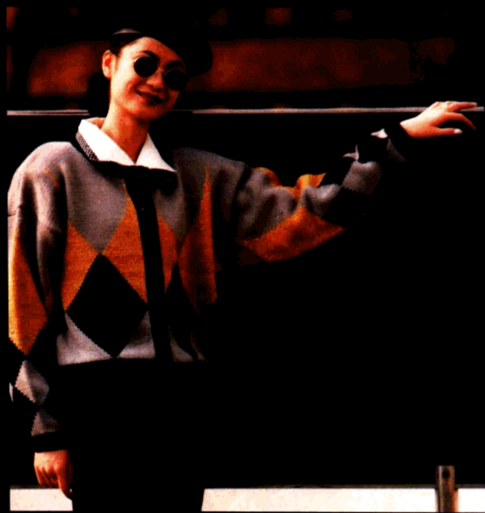
款3 三色菱形女开衫