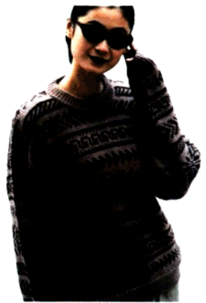
款 27 双色提花衫