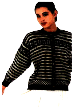
款 26 黑白横条衫