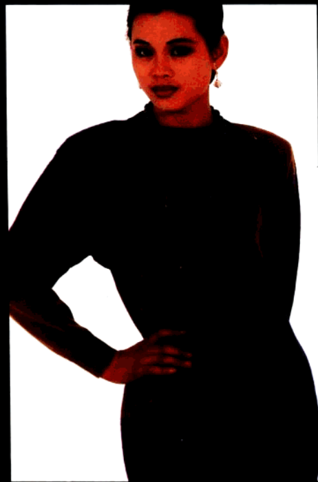
款 16 梯形中长套衫