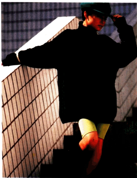
款 23 中高领棒针衫