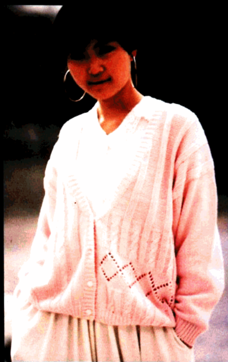
款 25 粉红休闲衫