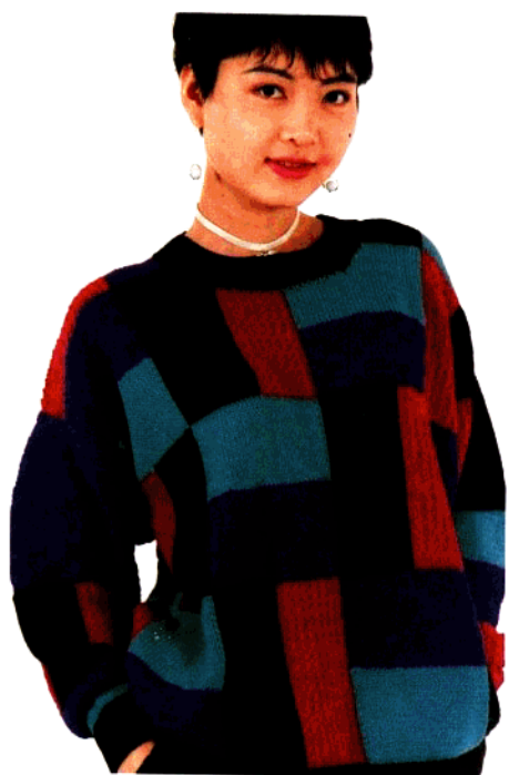
款 19 色块棒针衫