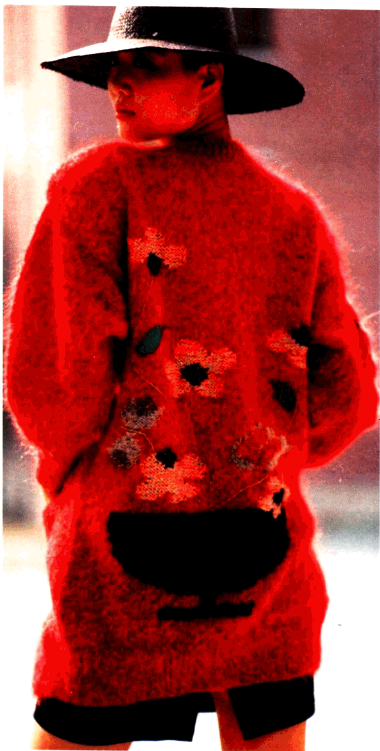
款 12 盆景图案女外套