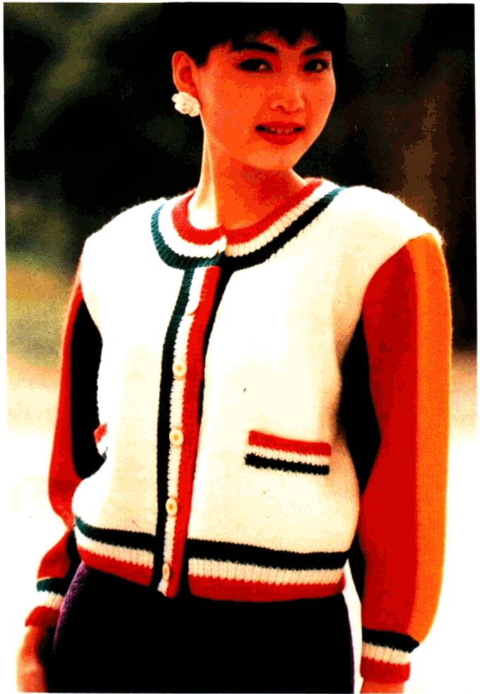
款 28 风景时装衫