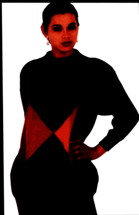
款 14 方块图案衫