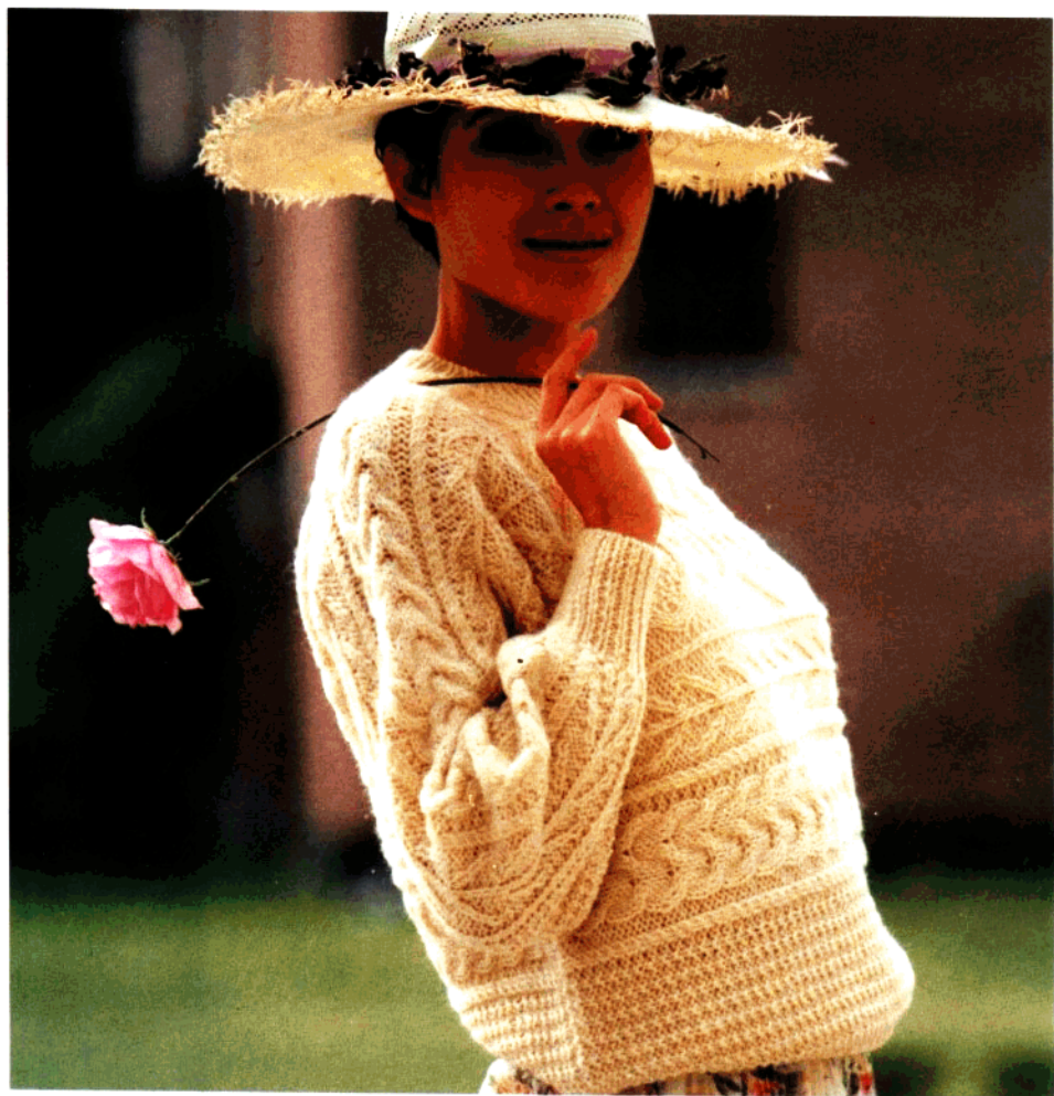
款1 白色棒针女套衫