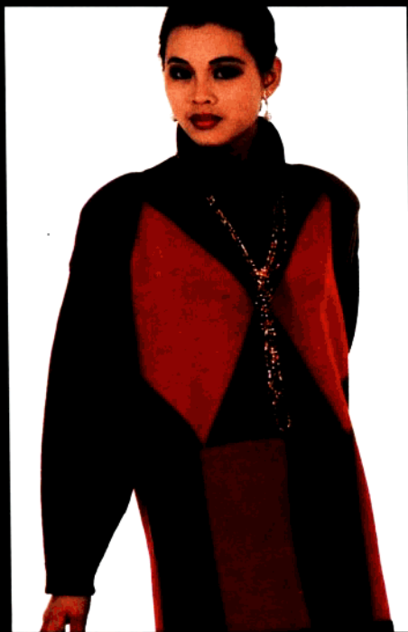
款 15 环领时装衫