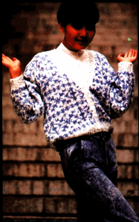
款 24 提花 V 领开衫