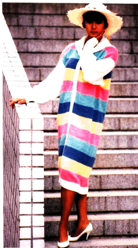
款 11 彩条连帽长外套