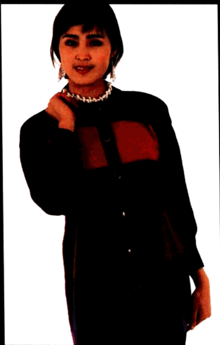
款 13 多彩时装衫