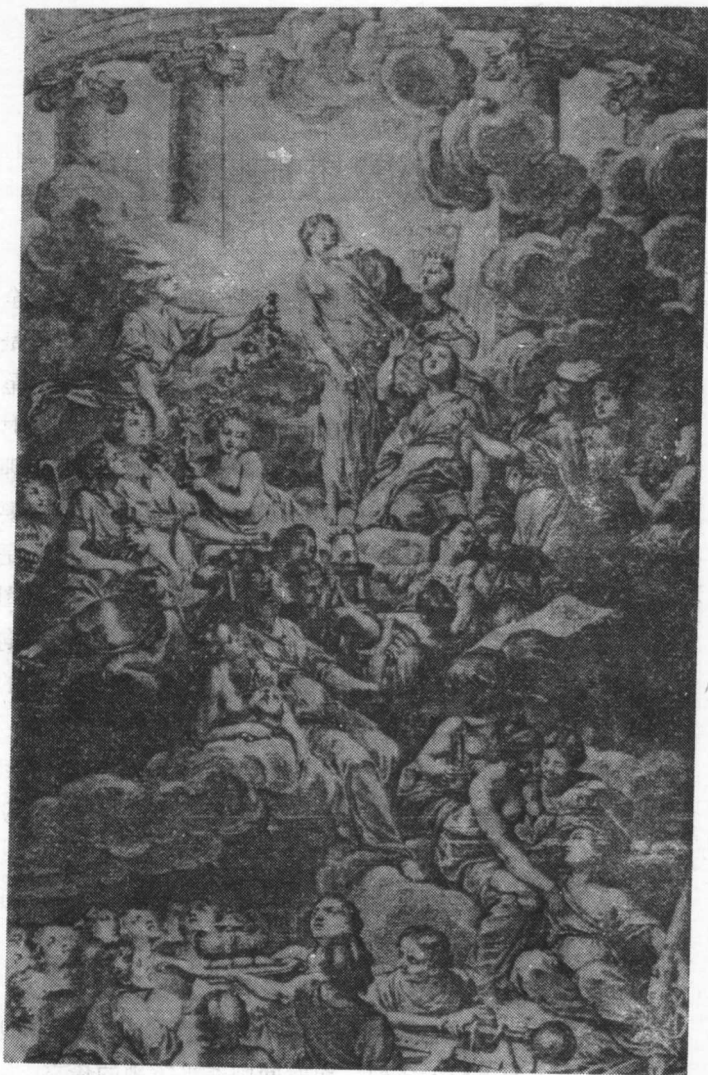
《百科全书》卷首插图