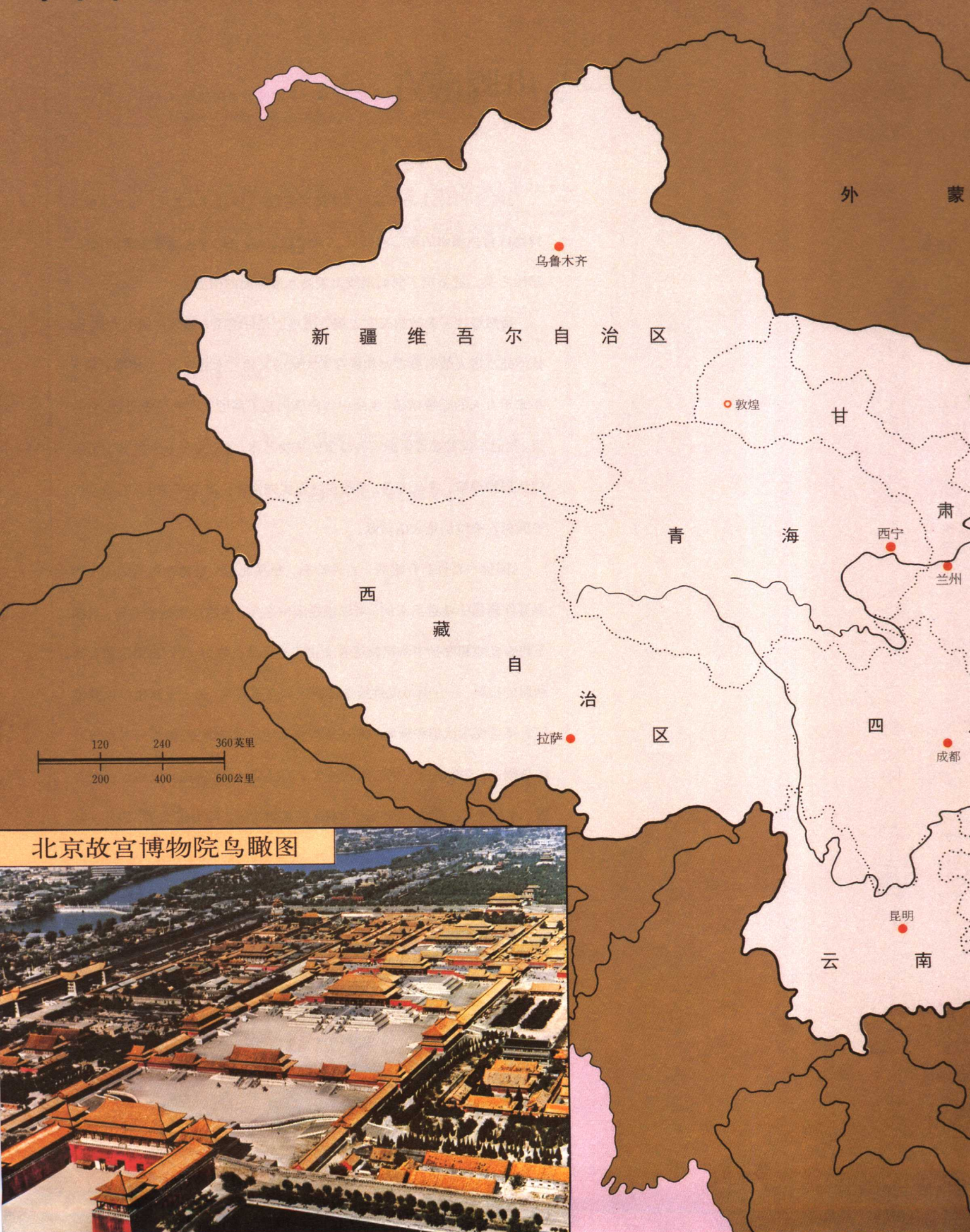
北京故宫博物院鸟瞰图