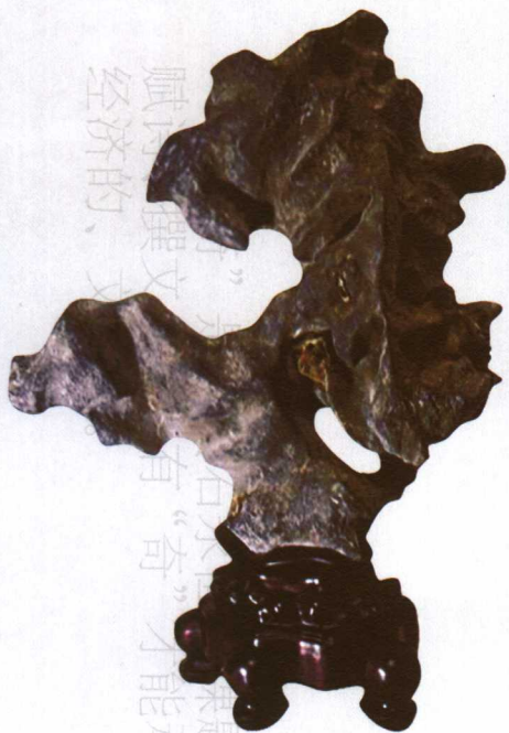
【名称】乳狮 【石种】灵璧石