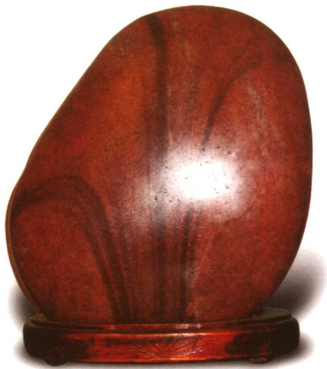
【名称】兰芳 【石种】黄河石 【规格】30cm × 26cm × 18cm 【收藏】刘兰芳

论是广西三江石、草花石、巴林鸡血石、钟乳石，还有名贵的福建寿山石，通通一视同仁。刘兰芳说，名贵的石头固然令人珍爱，但有些石头有特殊的纪念意义，代表了一种情感，则更值得收藏。如刘兰芳家客厅中摆放的那块广西三江石，石面上有三道流畅的黑色线条，如一株水墨画的兰花默默吐露芬芳，暗合了刘兰芳的名字，这是刘兰芳的老伴王印权搜寻到特意送给她的，在刘兰芳眼里，这才是真正值得收藏的珍宝。