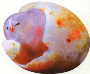
【名称】小鸡出壳 【石种】玛瑙

观赏石奇异度概念的提出，实现了对“奇”的程度能够刻画。这种刻画是对观赏石“奇”深入研究进行的有益尝试。由观赏石的“奇”引申而来的“奇异度”，为观赏石价值学的建立奠定了基础。