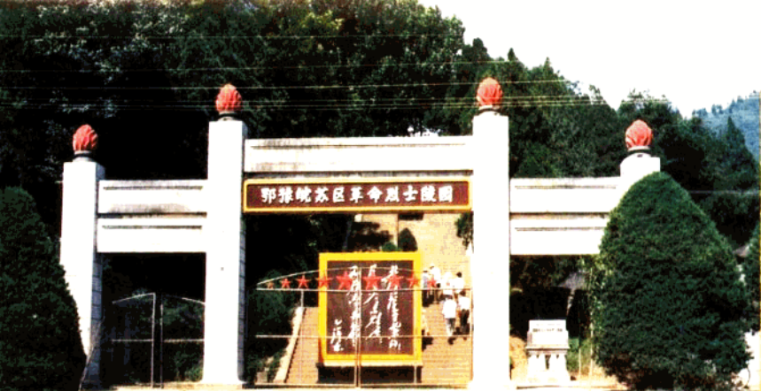
鄂豫皖苏区革命烈士陵园