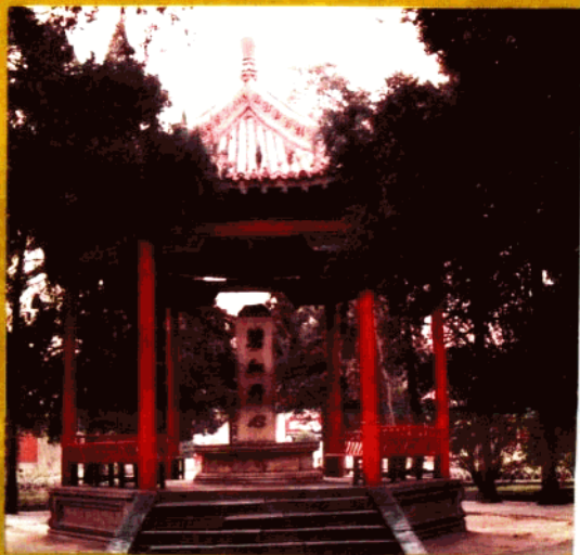
郑州碧沙岗公园内民族亭 (碑文为冯玉祥先生所题)