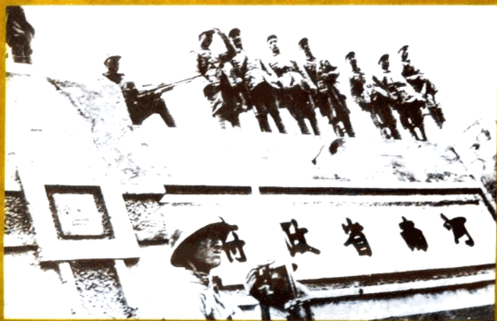
1948年6月，人民解放军第一次解放河南省会开封