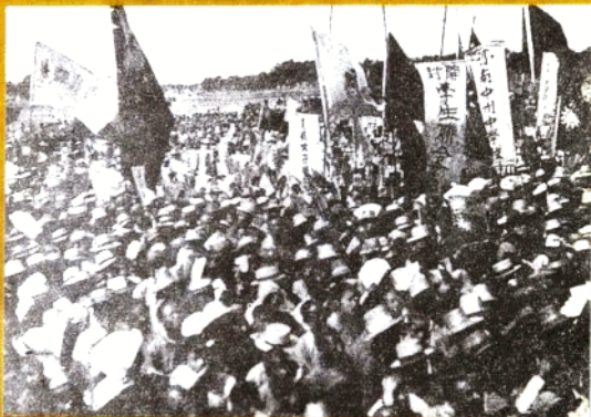
1927年开封人民集会欢迎北伐军