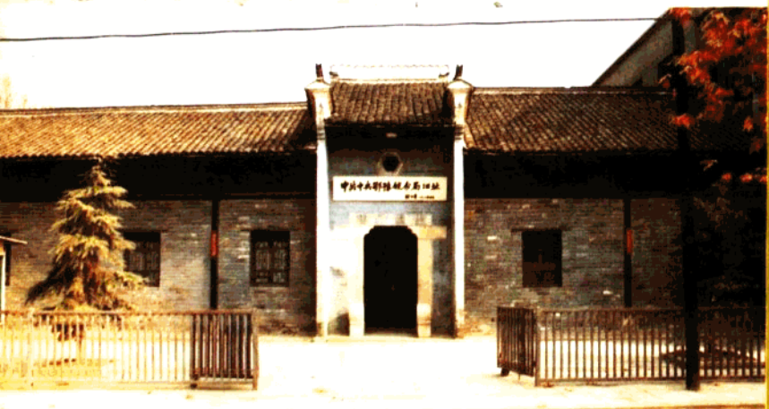
中共中央鄂豫皖分局旧址