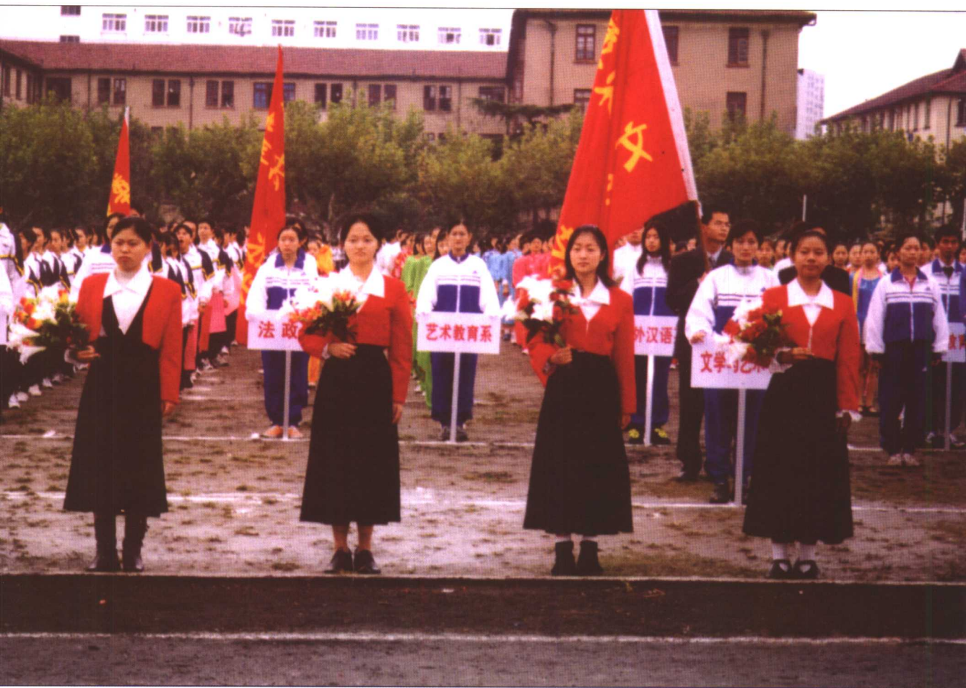
第四届体育节开幕式