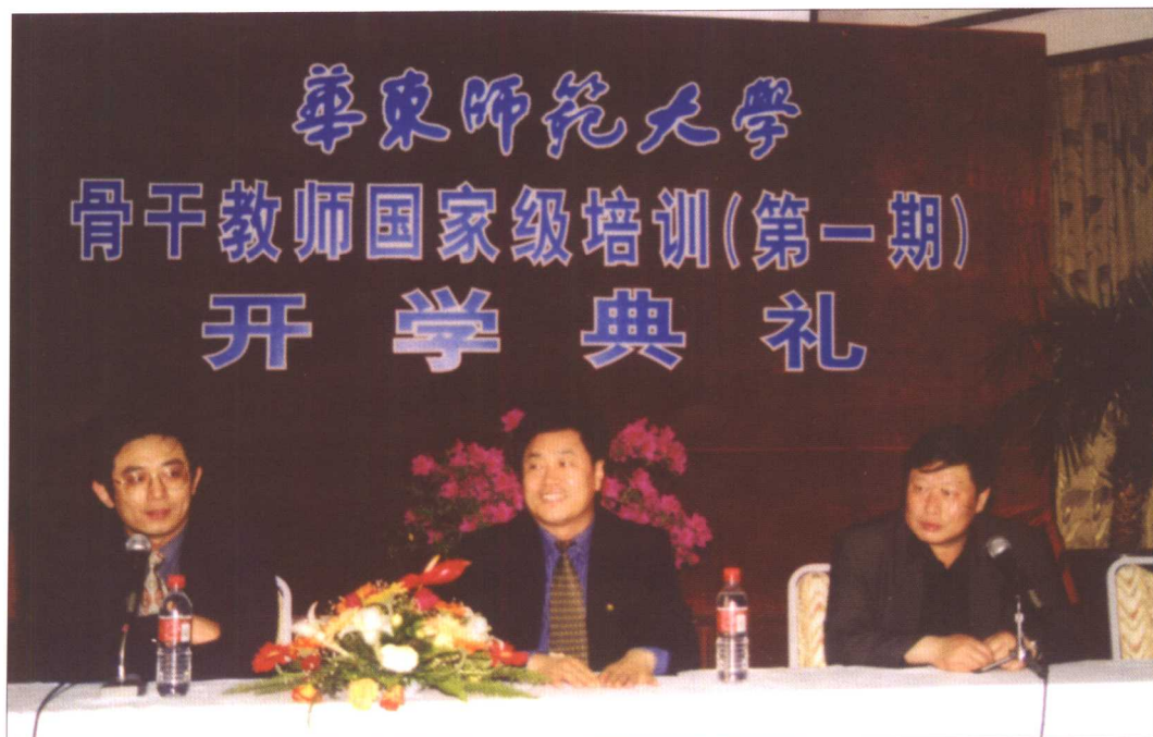
首期骨干教师国家级培训开学典礼