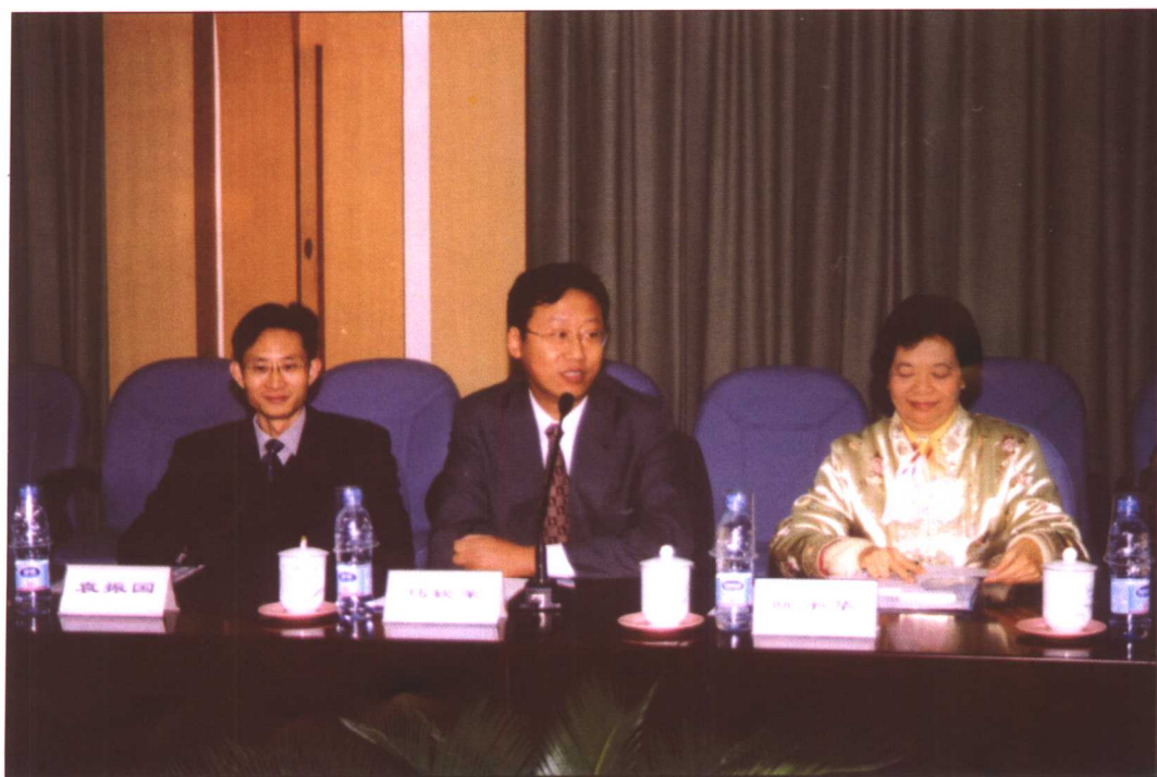
首届澳门中小学校长、主任教学管理研修班开学典礼