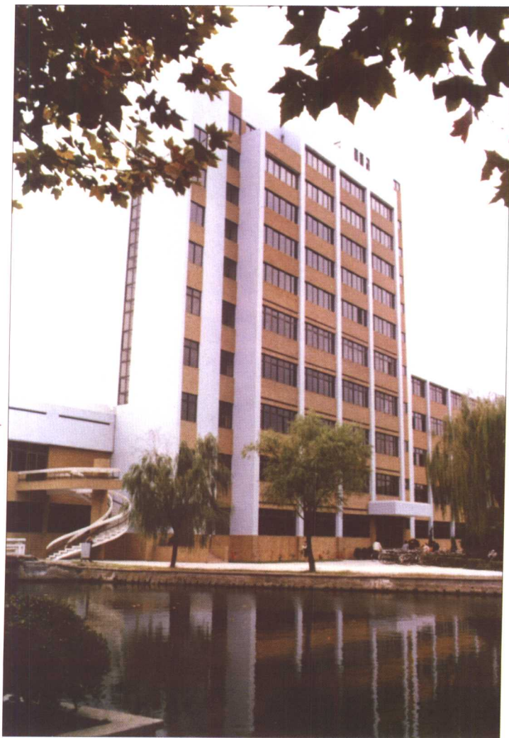
图 书 馆