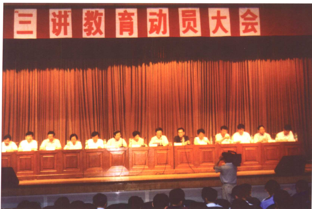
“三讲”教育动员大会