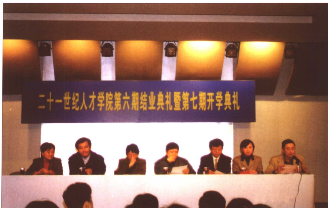
二十一世纪人才学院第六期结业典礼暨第七期开学典礼