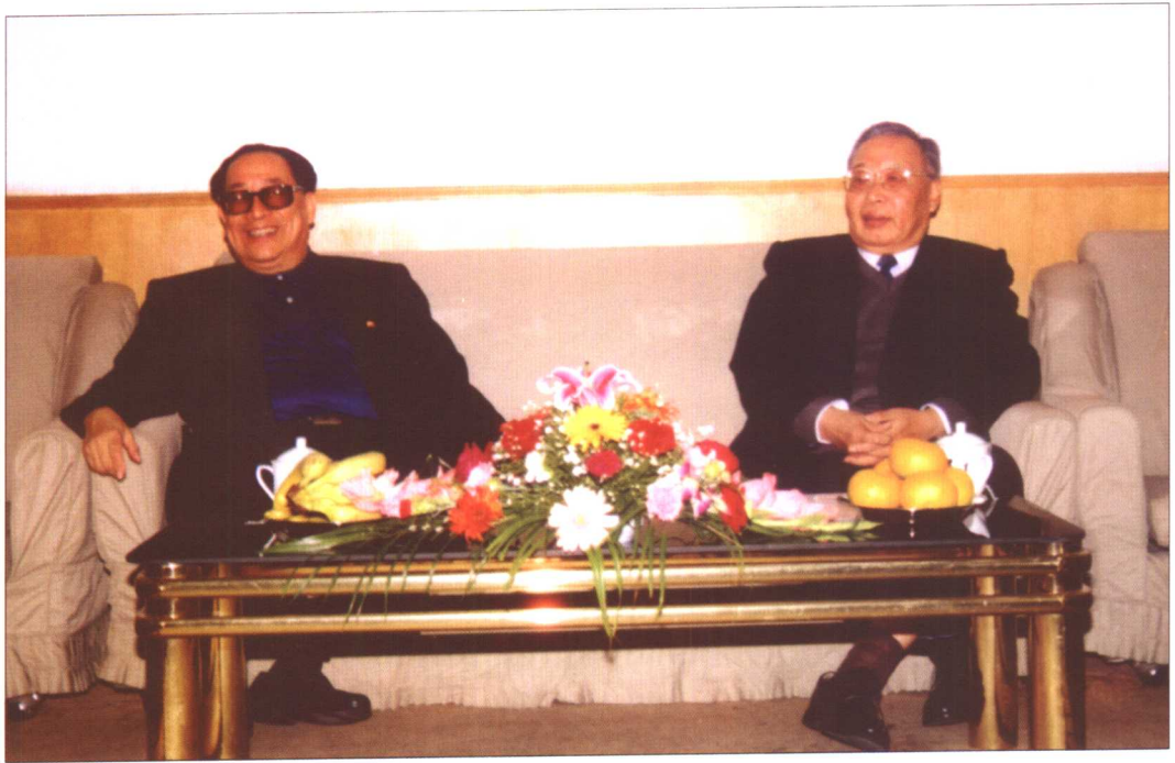
校友、中纪委副书记傅杰（左）在我校参加座谈活动