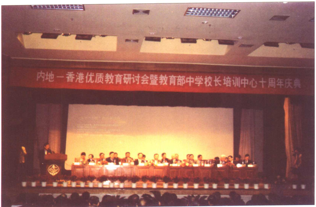
教育部中学校长培训中心成立十周年庆典