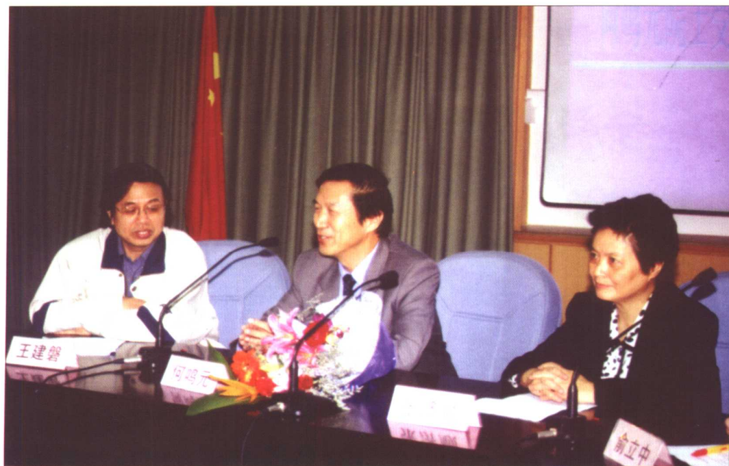
中国科学院院士何鸣元受聘我校教授仪式