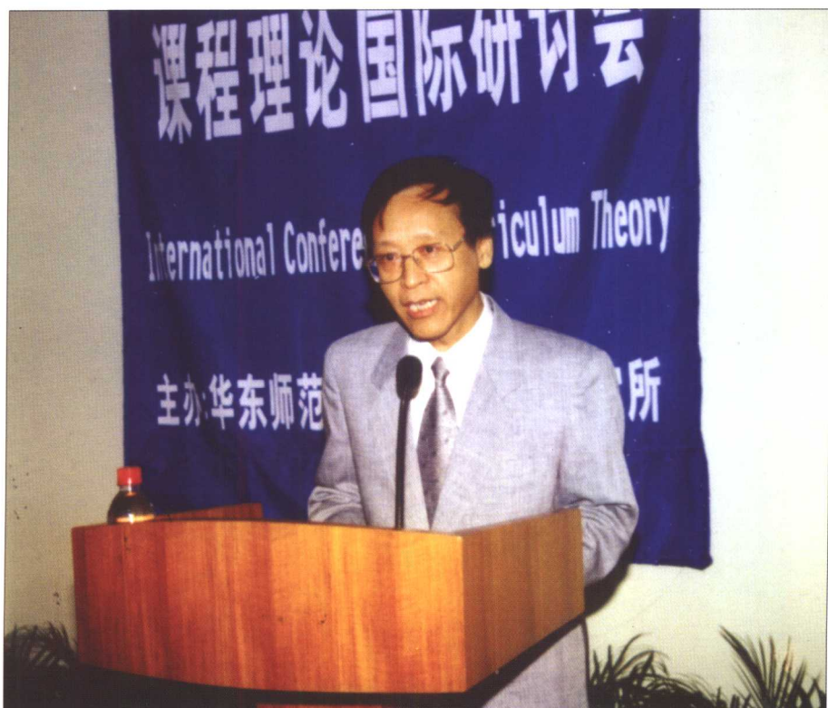
2000 课程理 论国际研讨会