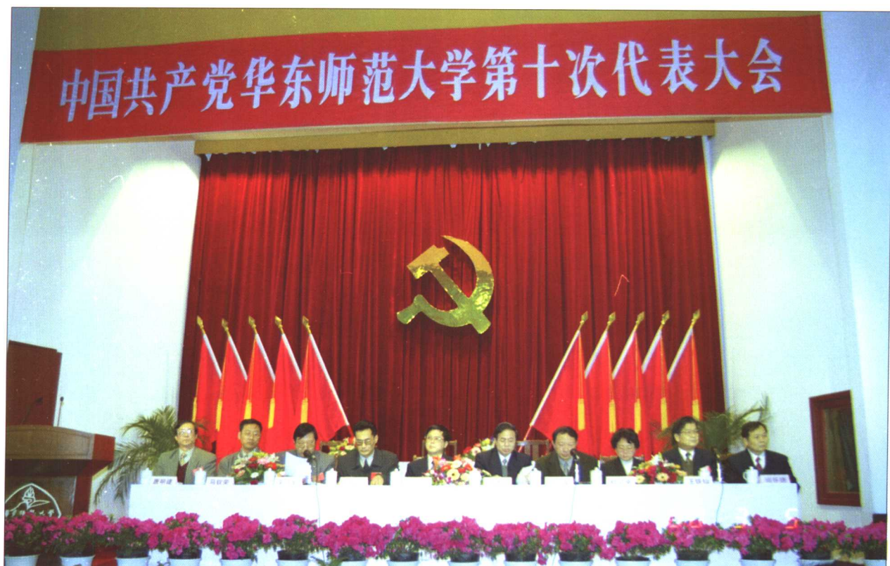
华东师范大学第十次党员代表大会