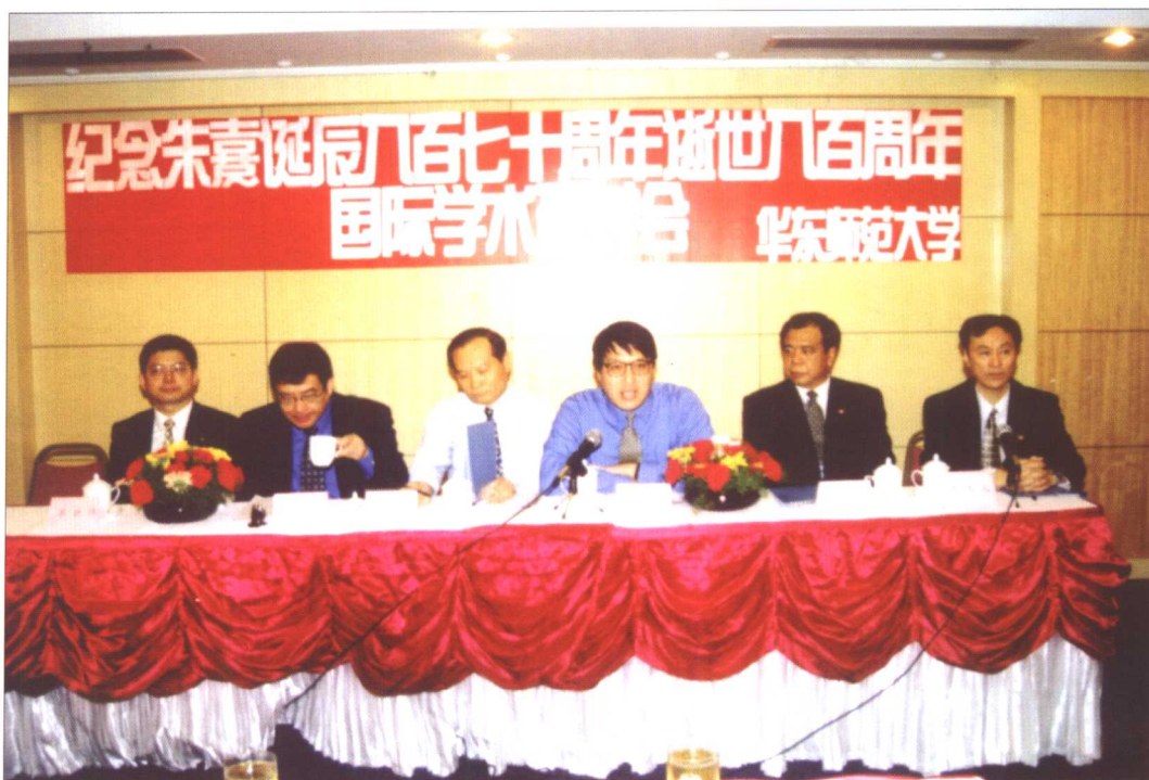
纪念朱熹诞辰八百七十周年、逝世八百周年国际学术研讨会