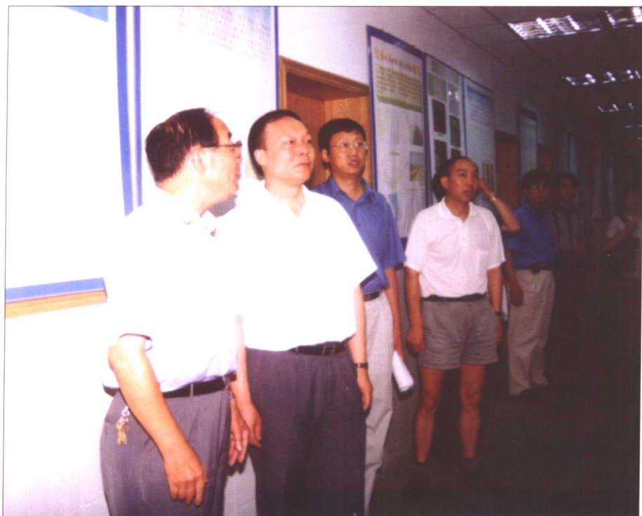
教育部副部长 王湛视察河口海岸 国家重点实验室