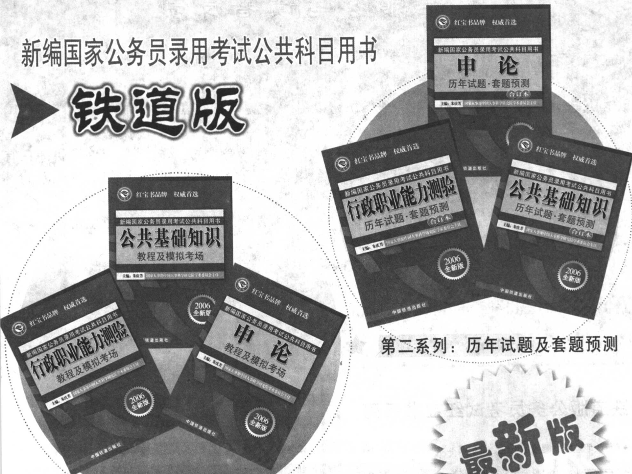
第一系列：教程及模拟考场