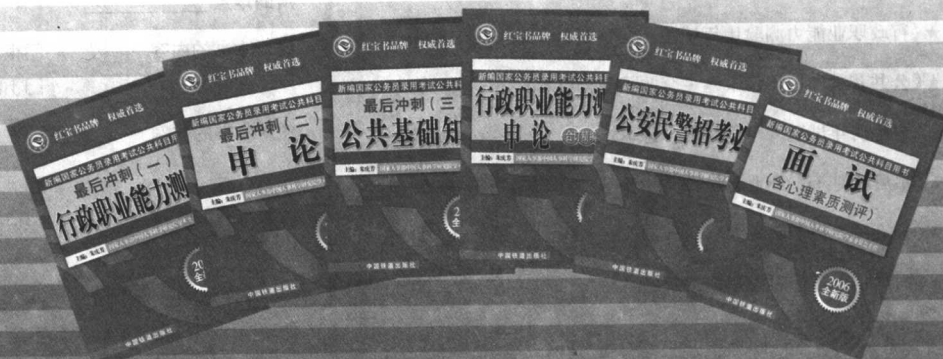
第三系列：最后冲刺、面试、公安民警招考必考 行政职业能力测验·申论合订精编本