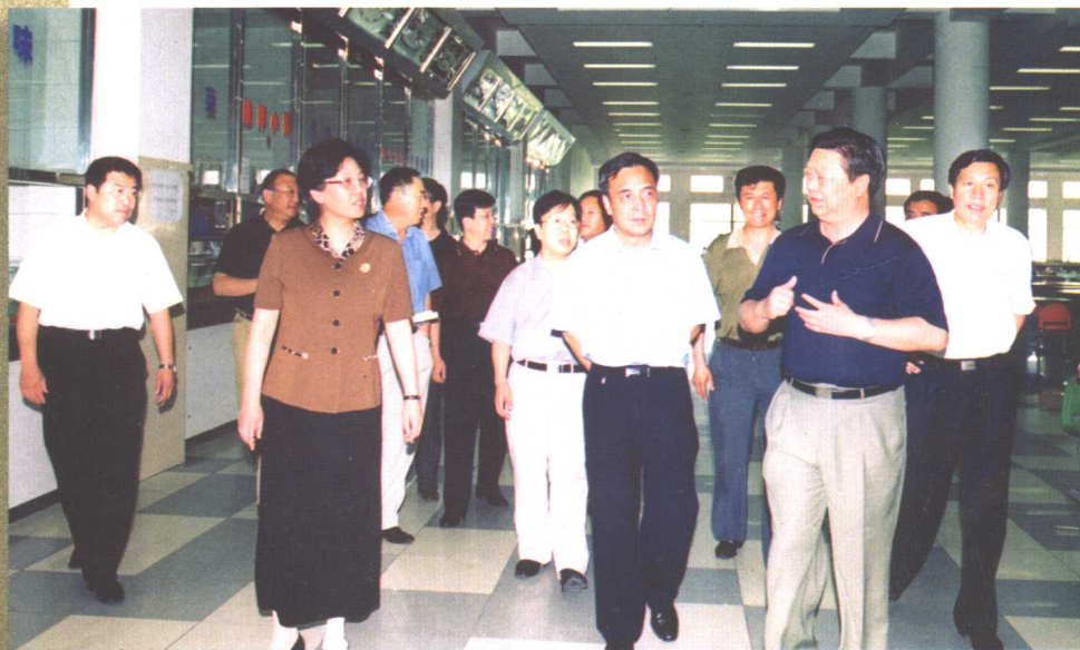
6月30日,以国家人口计生委副主任赵炳礼为组长的国务院“非典”防控督察组在副省长李斌、省卫生厅厅长李殿富的陪同下到我校进行检查指导。