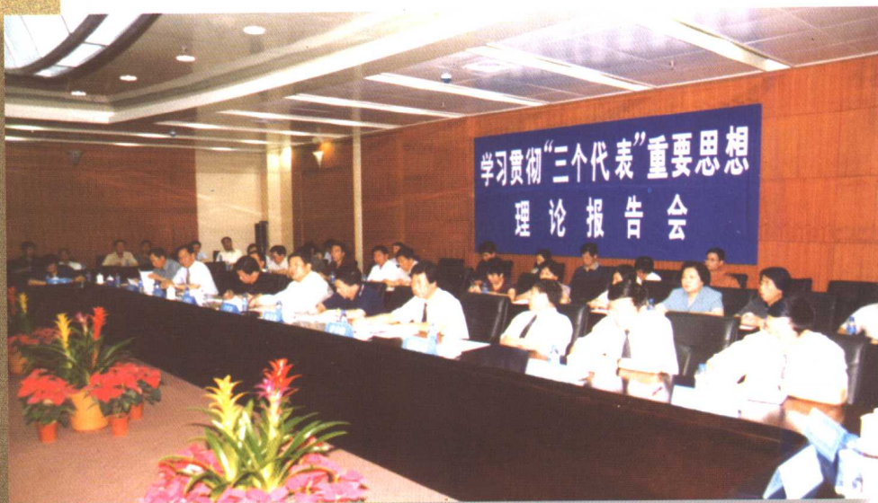
7月9日，吉林省委副书记全哲洙来我校为我校党委理论中心组成员及基层党委书记作“三个代表”重要思想理论报告。