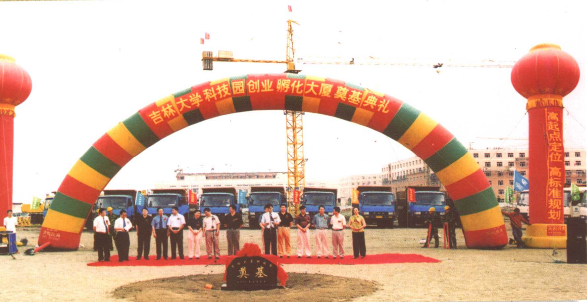
7月9日，学校举行科技园创业孵化大厦奠基典礼。吉林省副省长陈晓光出席了奠基仪式并为大厦奠基。