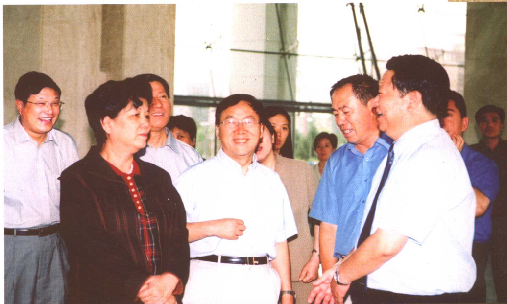
7月3日，国务委员陈至立、国务院副秘书长陈进玉、教育部副部长王湛、财政部副部长金立群和国家文物局局长单霁翔在省委、省政府领导的陪同下来我校进行视察。