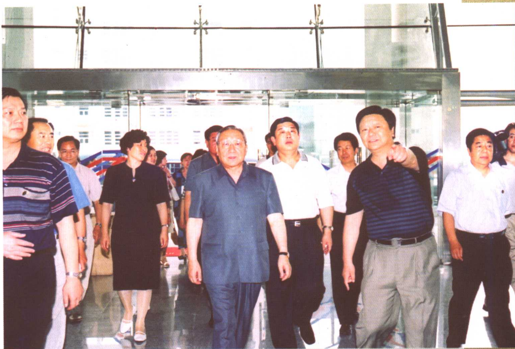
7月15日，国务院副总理李岚清在省委、省政府领导的陪同下来我校视察。