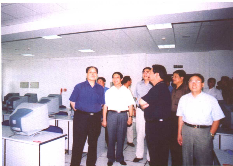
8月11日，教育部副部长张保庆来我校视察工作。