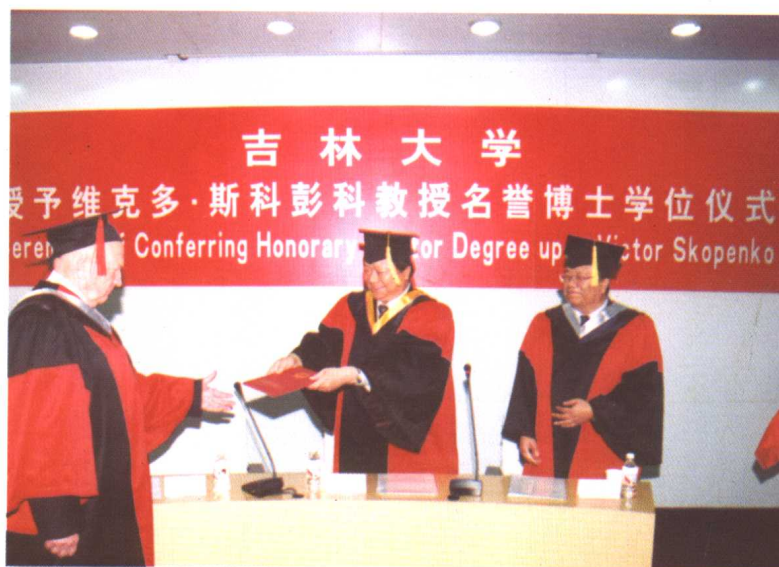
11月18日，吉林大学授予乌克兰基辅国立大学校长维克多·斯科彭科教授吉林大学名誉博士学位，这是我校首次将名誉博士学位授予国外学者。