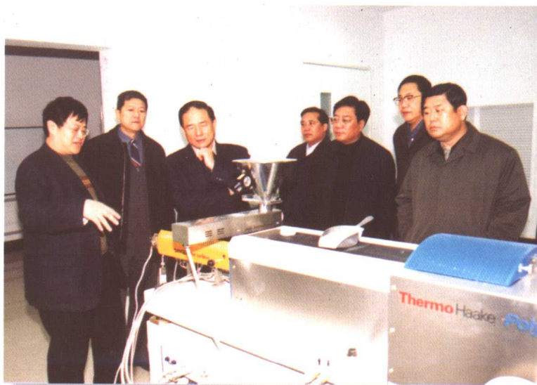
11月6日，吉林省委书记王云坤，副书记林炎志、全哲洙，副省长李锦斌来我校调研，考察我校部分实验室。