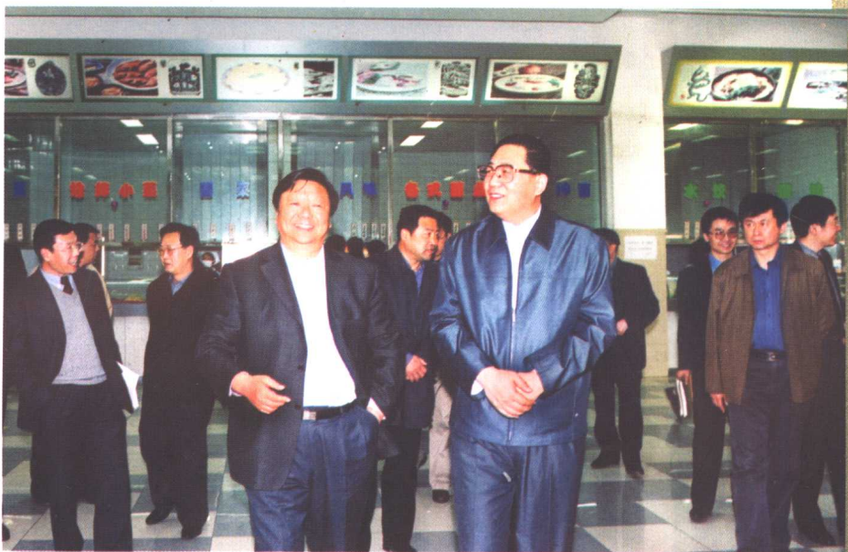
5月1日，吉林省副省长李锦斌率相关部门负责同志到我校检查“非典”防治工作落实情况。