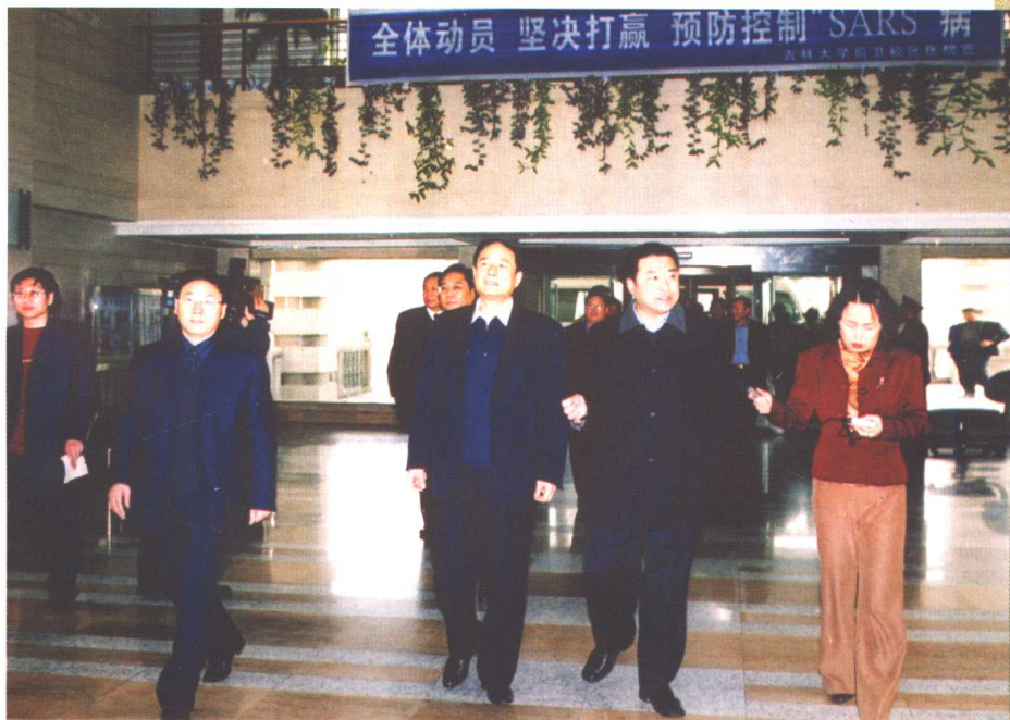
4月22日，省委书记王云坤、省委秘书长李申学和有关部门负责同志来我校视察“非典”防治工作。