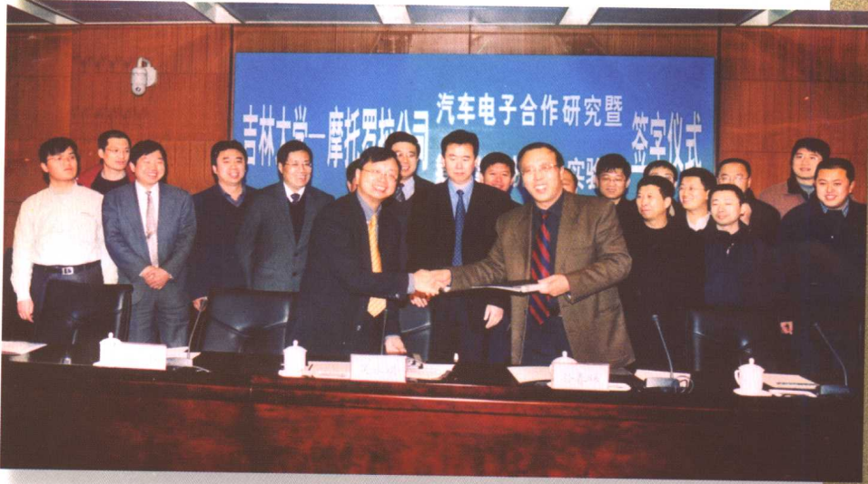
10月20日，吉林大学——美国国家仪器公司虚拟仪器联合实验室揭牌仪式在我校举行。