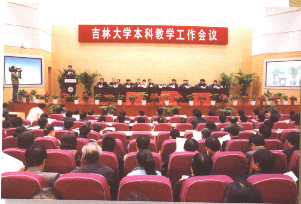
10月22日，我校召开本科教学工作会议，这是合校以来学校首次召开的本科教学工作会议。