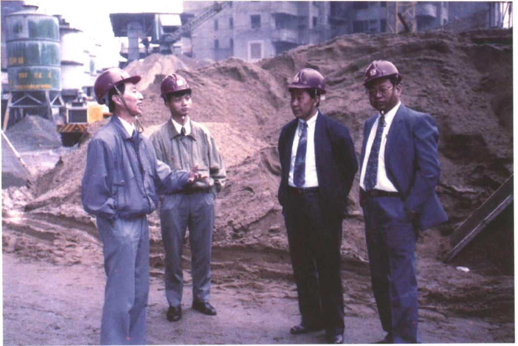
2004年青林同志在中建五局视察CI现场