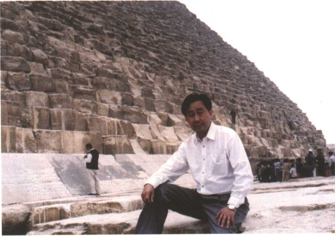
青林同志在埃及 金字塔处留影