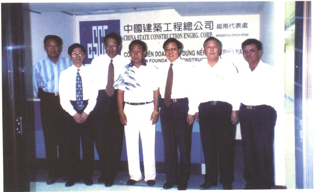
青林同志（中）与中建越南代表处同志合影