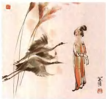
天地一沙鸥 53cm x 69cm 王孝纲