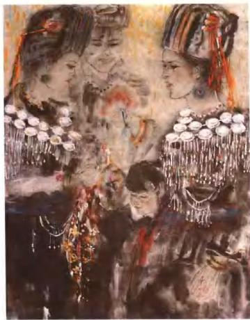
早春二月 92cm × 68cm 马先虎