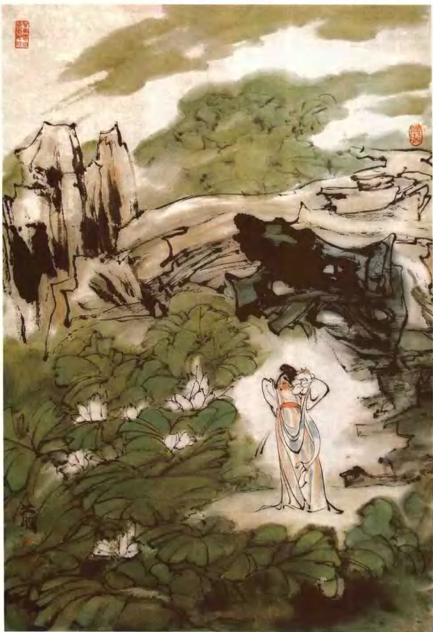
1 田米制之荷图 106cm x 69cm 江树宏