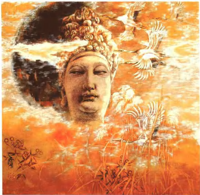
天地玄黄 68cm x 68cm 王孝纲