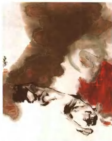
伏虎图 90cm x 70cm 王孝纲