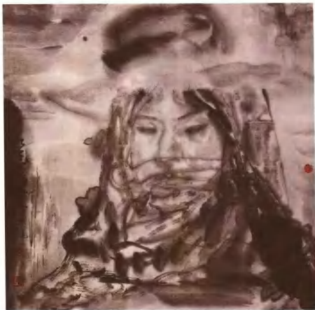
藏女 68cm × 68cm 马先虎