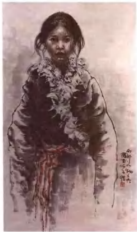
西部人物—藏族少女 130cm x 86cm 何子健