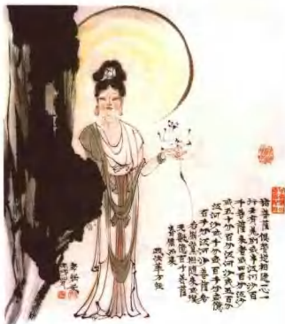
菩萨 69cm x 98cm 王孝纲