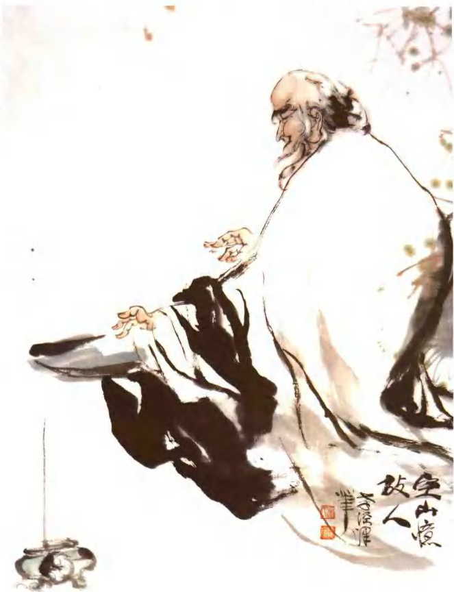
空山忆故人 97cm x 69cm 王孝纲