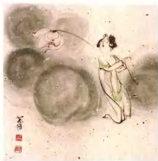
荷叶似云香不断 53cm x 68cm 王孝纲