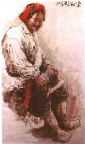
高原人物—藏族老人 136cm x 68cm 何子健