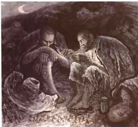
何子健 藏人 170cm x 170cm