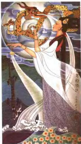
右：水仙花的传说 103cm x 56cm 姜沐新 左：水仙花的传说 58cm x 110cm 姜沐新