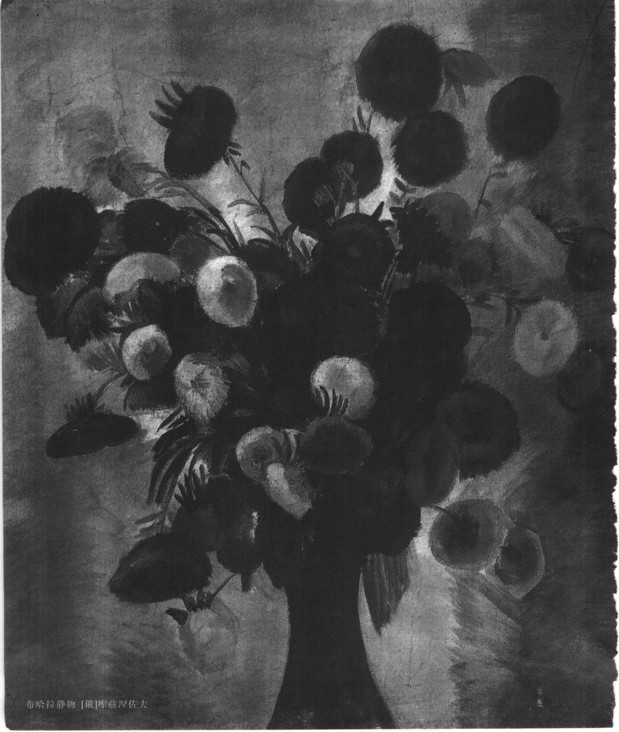
布哈拉静物 [俄]伊兹涅佐夫