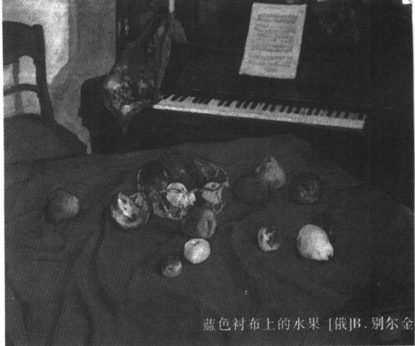
蓝色衬布上的水果 | 俄画·别尔金