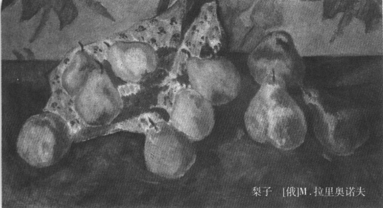
梨子 [俄]M.拉里奥诺夫