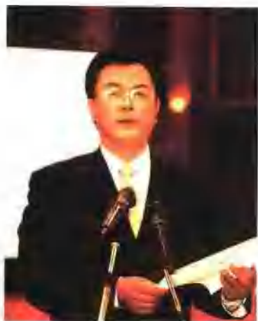
昆明市人民政府副市长 雷晓明